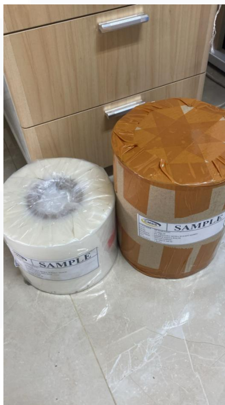
Gambar 2.1.3 Sample produk roll