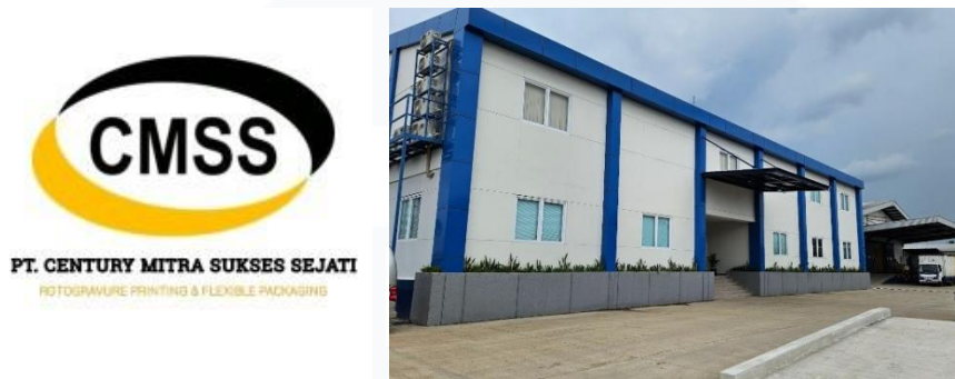
Gambar 2.1.1 Logo dan PLANT 2 CMSS

mendapatkan penghargaan "Indonesia Green Company Award" untuk kategori "Perusahaan Percetakan dan Kemasan".