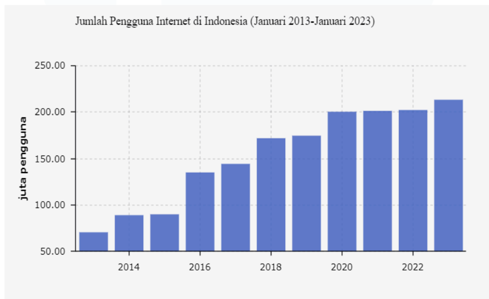
Gambar 1.1 Pertumbuhan jumlah pengguna Internet di Indonesia (2013-2023)

Perkembangan teknologi informasi dan komunikasi semakin pesat seiring dengan perkembangan zaman. Perkembangan teknologi informasi dan komunikasi yang terjadi, berdampak pada semua sektor, seperti bisnis, kesehatan, perbankan, finansial, perkantoran, keamanan, bahkan pemerintahan. Hal ini bisa terlihat dari perkembangan jumlah pengguna internet di Indonesia yang semakin bertambah dari tahun ke tahunnya. Berikut ini terlampir data pertumbuhan pengguna internet di Indonesia dari tahun 2013 - 2023 :