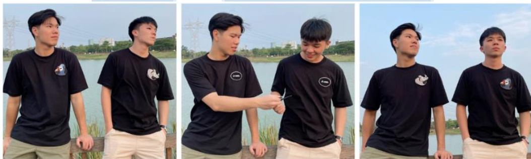
Gambar 2. 3 Penggunaan Produk Svstain

Svstain merupakan bisnis yang berada pada industri fashion , yang berfokus pada gaya busana kasual. Svstain menawarkan produk berupa baju kaos yang dilengkapi dengan sebuah tempelan patch yang didesain secara khusus. Inovasi pada desain baju Svstain terletak pada penggunaan velcro untuk mengaplikasikan patch tersebut. Pengaplikasian velcro memungkinkan patch yang diproduksi dapat dilepas pasang sehingga baju dapat memiliki banyak desain. Desain patch tersebut juga dibuat customizable sehingga dapat memberikan kesempatan bagi pelanggan untuk mengekspresikan kreativitas dan selera fashion mereka. Berikut adalah contoh penggunaan produk Svstain dengan patch yang dapat dilepas pasang: