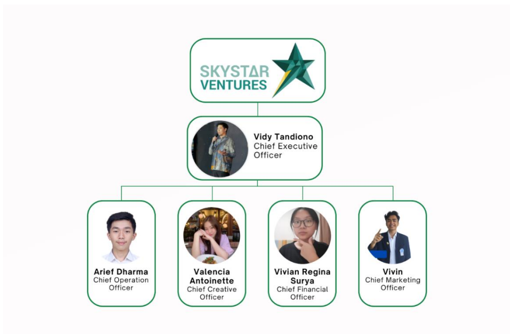
Gambar 2. 5 Struktur Organisasi Svstain

Selain struktur organisasi Skystar Ventures di atas, terdapat struktur organisasi Svstain yang merupakan bisnis di bawah naungan Skystar Ventures, yaitu sebagai berikut: