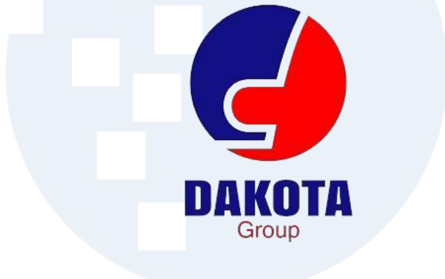
Gambar 2.1 Logo Perusahaan PT Dakota Cargo