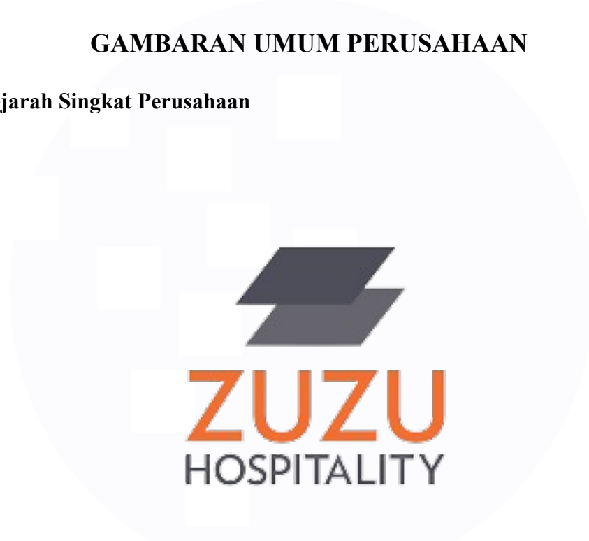
Gambar 2.1 Logo Zuzu Hospitality