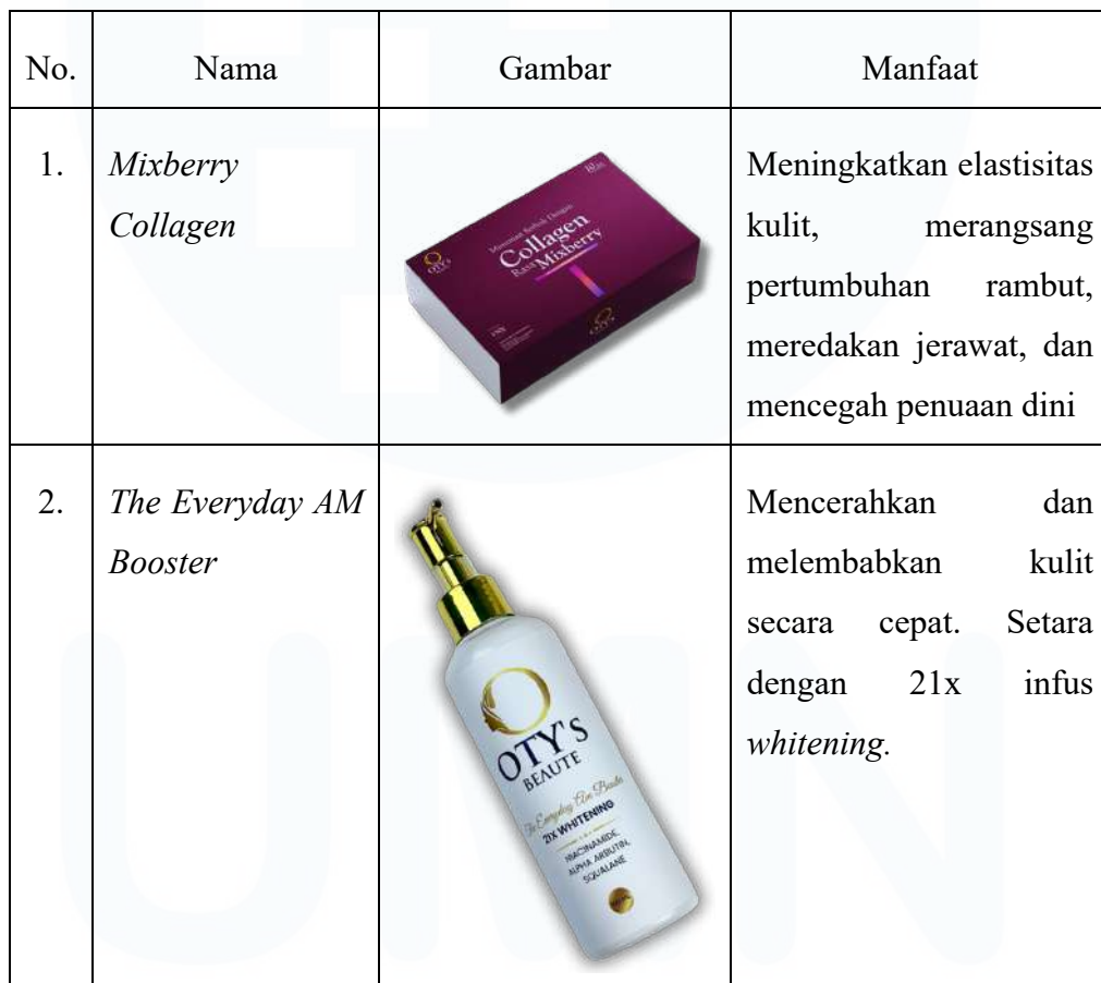
Tabel 2. 1 Produk PT Otis Kosmetika Indonesia

Gambar diatas merupakan logo yang digunakan PT Otis Kosmetika Indonesia. Warna emas pada logo dapat menciptakan perspektif konsumen dengan kesan anggun, mewah, serta cantik. Sedangkan gambar Wanita pada logo dapat menarik perhatian para wanita yang mendominasi target pasar. Adapun tagline Perusahaan yaitu “ Bare With Healthy Skin ” yang dimana dapat memberikan kesan pada Wanita bahwa kecantikan sejati dapat diperoleh dengan memiliki kulit yang sehat. PT Otis Kosmetika Indonesia memiliki beberapa produk yang didistribusikan, berikut produknya: