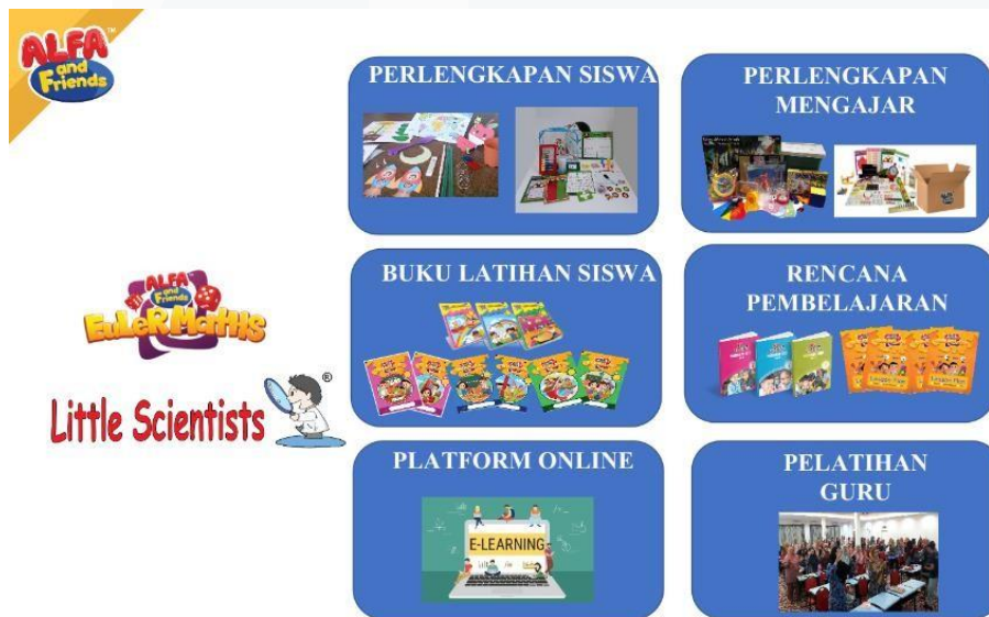
Gambar 2.2 Produk Program Science Alfa and Friends

Akademi, Wawasan dan Yayasan. Masa depan kami didorong oleh program dan layanan terintegrasi yang memadukan pengalaman fisik dan digital, pengalaman langsung dan virtual dengan platform konten, pengetahuan, dan informasi yang mendukung, mengembangkan, dan meningkatkan pengajaran dan pembelajaran.