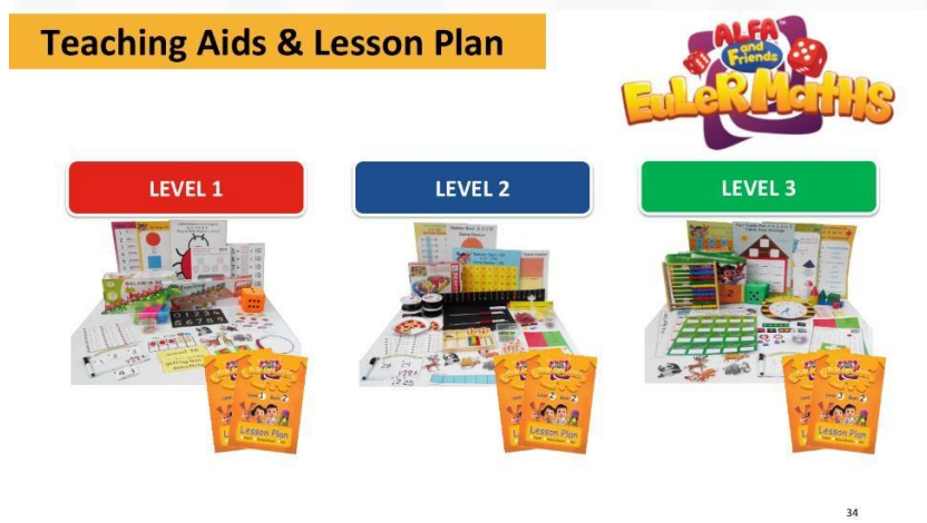
Gambar 2.3 Produk Program Maths Alfa and Friends