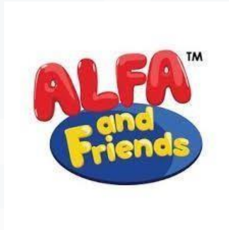
Gambar 2. 1 Logo PT Alfa and Friends