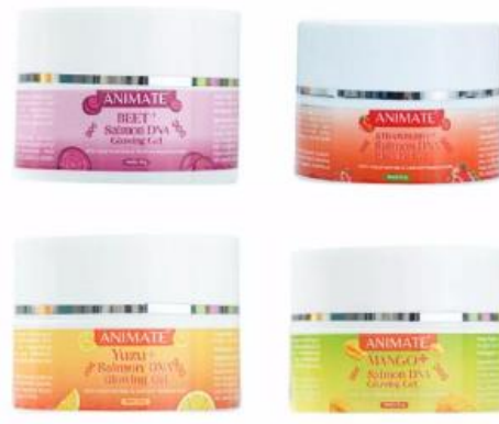
Gambar 2. 4 Salmon DNA Gel