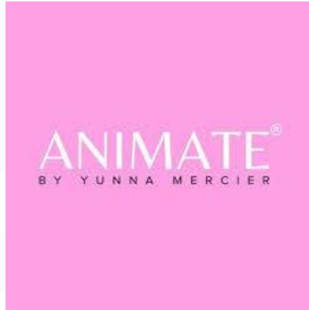
Gambar 2. 1 Logo Animate by Yunna Mercier