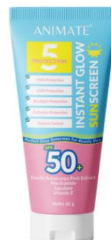
Gambar 2. 3 Sunscreen