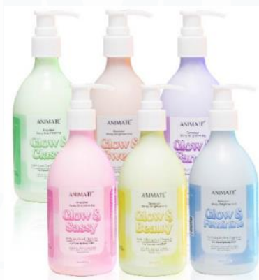
Gambar 2. 6 Bodycare