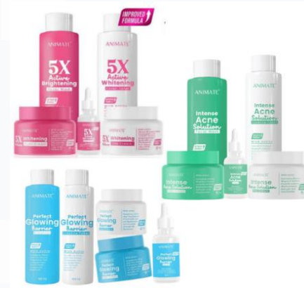
Gambar 2. 2 Series Animate