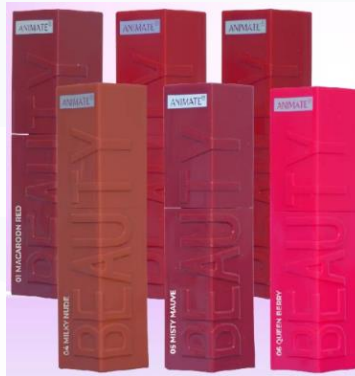
Gambar 2. 5 Lipcream