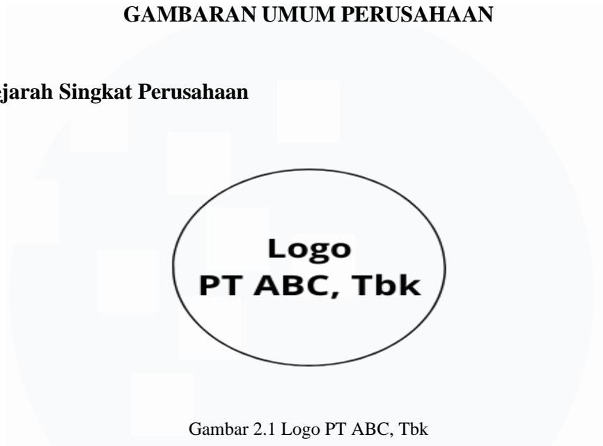
Gambar 2.1 Logo PT ABC, Tbk

PT ABC, Tbk didirikan pada tahun 1979, sebagai bagian dari PT ABC, Tbk dengan kepemilikan saham yang dimiliki oleh Pemerintah Daerah Khusus Ibukota (Pemda DKI). Sejak didirikan, PT ABC, Tbk telah berkembang menjadi salah satu perusahaan utama dalam sektor industri properti di Indonesia, yang berfokus pada pengembangan properti perumahan dan komersial di sekitar wilayah Selatan Jakarta. Proyek utama dari perusahaan adalah pengembangan kawasan elit, dimulai dari awal berdirinya pada tahun 1979. Dengan luas yang meliputi luas wilayah 2.000 hektar. Kota ini menawarkan berbagai jenis perumahan, fasilitas komersial, kondominium, pendidikan, rekreasi, olahraga, kesehatan, dan transportasi yang lengkap. PT ABC, Tbk membangun citra kota yang aman dan tertata dengan baik, serta ditujukan untuk profesional dan intelektual.