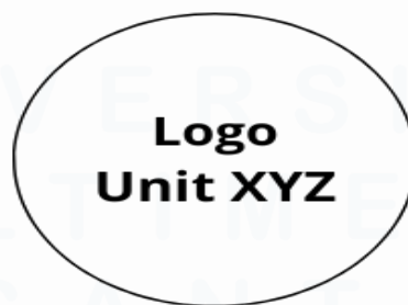
Gambar 2.2 Logo PT ABC, Tbk Unit XYZ

Salah satu aspek yang membuat PT ABC, Tbk dapat menjadi perusahaan properti yang utama bagi masyarakat Indonesia adalah memiliki komitmen untuk memperhatikan keberlanjutan lingkungan dan pertumbuhan yang bertanggung jawab. PT ABC, Tbk merancang Setiap proyeknya dengan memperhatikan dampak lingkungan serta kebutuhan masyarakat sekitar, hal ini menjadikan PT ABC, Tbk pemimpin industri properti yang bertanggung jawab dan agen perubahan yang membawa dampak positif bagi lingkungan dan manusia.