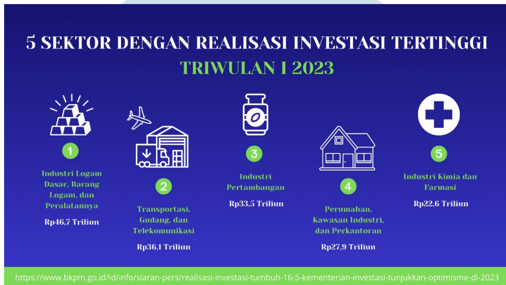
Gambar 1.2 Sektor Dengan Realisasi Investasi Tertinggi

Penanaman Modal Dalam Negeri sebesar 46,2 persen dengan nilai sebesar Rp151,9 triliun.