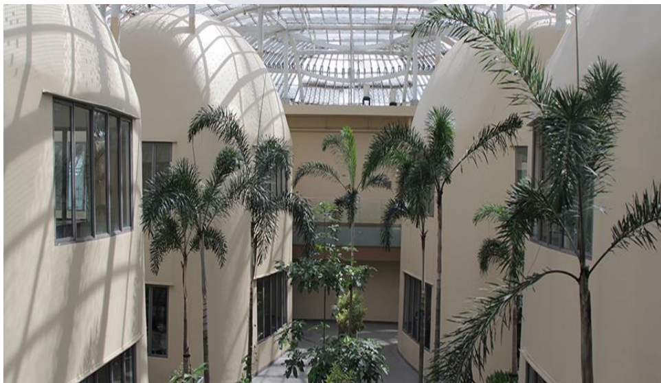
Gambar 2. 2 Gedung Skystar Ventures, Gedung C lantai 12 UMN

berbagai startup melalui tiga pilat utama yaitu, Incubator Program Coworking Space dan venture capital yang berbasis teknologi dengan menghubungkan mentor dengan peserta yang relevan dan menyediakan ruang kerja bersama yang kolaboratif untuk digunakan oleh mahasiswa Skypreneur dan anggota Skypreneur lainnya untuk bekerja, rapat dan sebagai ruang komferensi. Skystar Ventures memiliki program inkubator yang dapat dikatakan komprehensif, karena dapat memungkinkan pertumbuhan yang lebih cepat melalui dukungan langsung dan penerapan multidisiplin kepada Startup melalui program inkubasi yang disediakan dari Skystar Ventures. Skystar Ventures juga memiliki beragam jaringan mentor yang membimbing dan membantu para startup dalam membangun bisnisnya, dengan begitu startup dapat melakukan perkembangan sesuai dengan rencana anggota tim. Skystar Ventures saat ini telah mendirikan 29 startup, yang merupakan bagian dari Global Accelerator Network and Tech in Asia, dan merupakan salah satu mitra dari Ristekdikti.