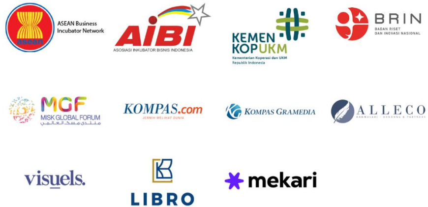
Gambar 2.3 Partner perusahaan Skystar Ventures