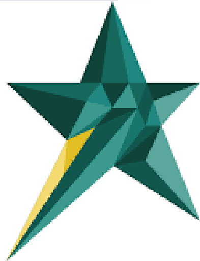
Gambar 2. 1 Logo Perusahaan Skystar Ventures