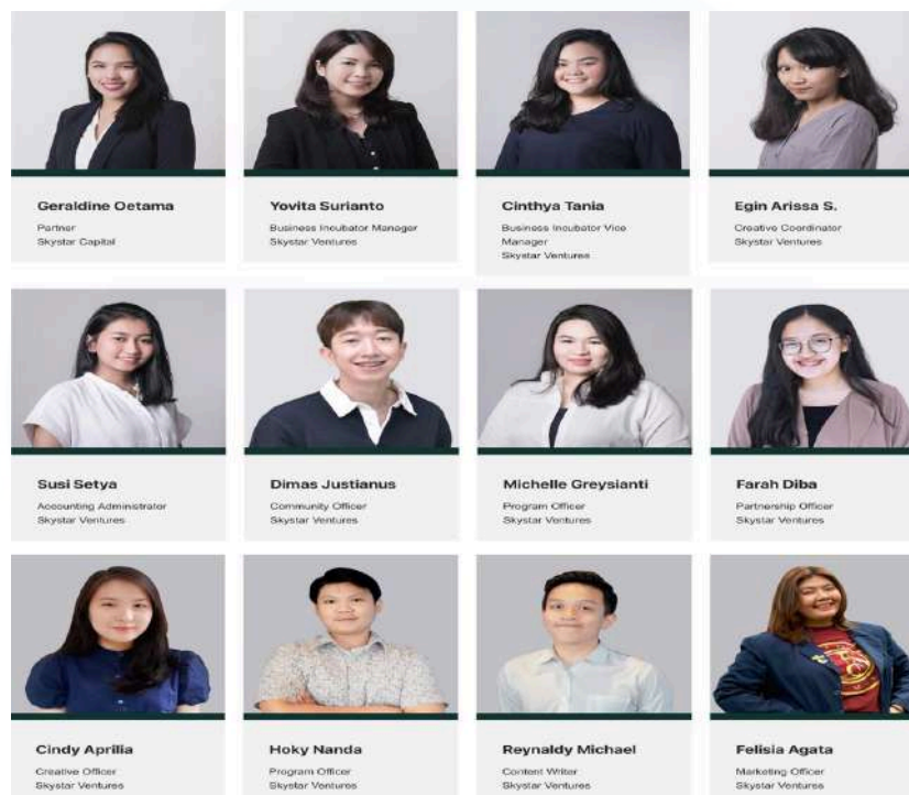
Gambar 2.3 Struktur Organisasi Skystar Ventures

Pada gambar 2.3 menunjukkan struktur organisasi dari Skystar Ventures. Berikut merupakan penjelasan dari tiap divisi: