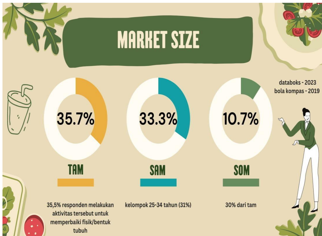
Gambar 2.2 Market Size

Produk yang akan kami ciptakan adalah minuman protein yang diformulasikan untuk memberikan dukungan nutrisi maksimal bagi individu yang aktif secara fisik dan peduli terhadap asupan gizinya. Fit Naturale adalah minuman protein inovatif yang dirancang khusus untuk mendukung kebugaran dan kesehatan tubuh. Produk ini hadir dalam bentuk minuman siap minum yang praktis dikonsumsi dengan mudah di mana saja dan kapan saja. Fungsi utama dari minuman protein kami adalah untuk memudahkan konsumen dalam mencukupi kebutuhan protein harian mereka, khususnya setelah berolahraga, untuk membantu pemulihan otot dan pertumbuhan massa otot yang sehat. Formulasi produk mengandung campuran protein berkualitas tinggi, vitamin, dan serat alami dari buah-buahan pilihan. Produk ini mendukung kesehatan tubuh secara keseluruhan, membantu menjaga keseimbangan nutrisi dan pencernaan. Keberadaan nutrisi ini bertujuan untuk memberikan dukungan komprehensif untuk kebutuhan tubuh, terutama bagi mereka yang aktif di dunia kebugaran. Minuman ini akan tersedia dalam berbagai varian rasa buah, seperti mangga pear, strawberry naga, kiwi melon, dan semangka.