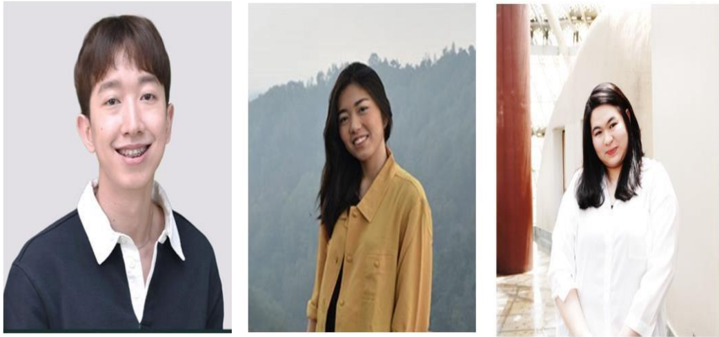
Community Officer SkyStar Ventures