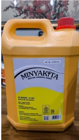
Gambar 2.3: Produk yang dijual PT MFA Multi Industry: Minyak Curah