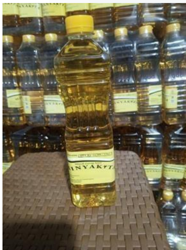
Gambar 2.4: Produk yang dijual PT MFA Multi Industry: Minyak Curah