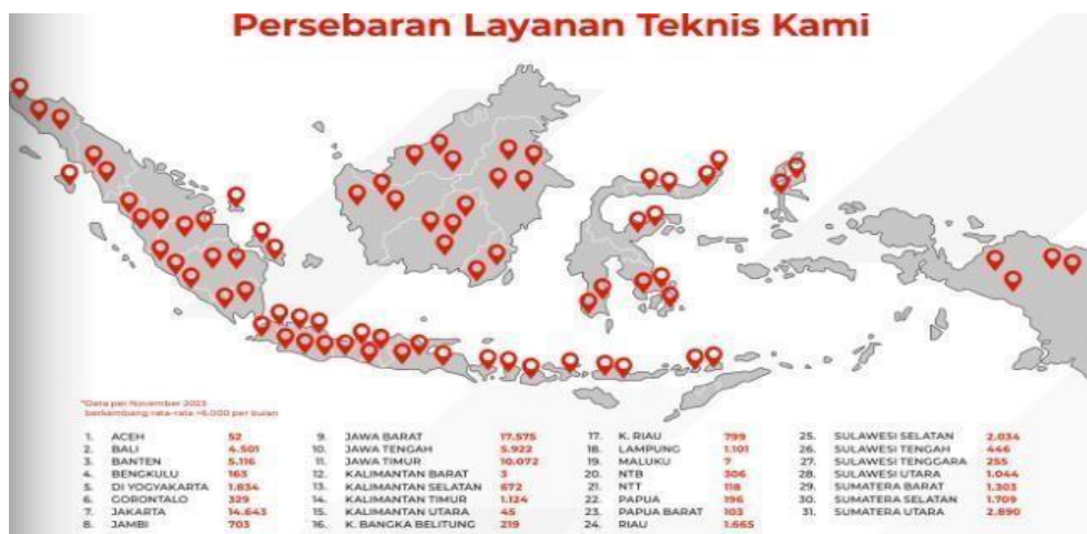
Gambar 2.3 Persebaran layanan PCS seluruh Indonesia

Dengan demikian, PCS Payment tidak hanya mendukung peningkatan efisiensi bisnis, tetapi juga mendorong inklusi keuangan yang lebih luas di Indonesia.