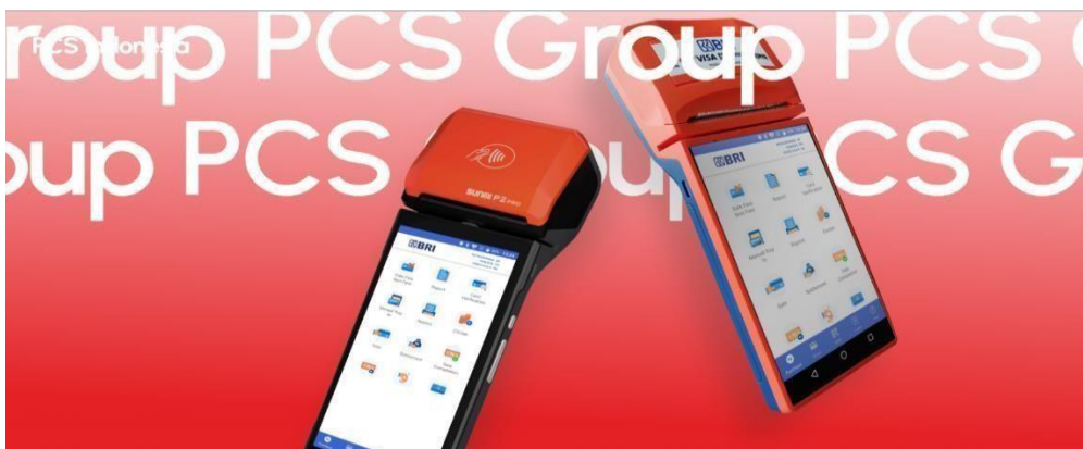
Gambar 2.2 Mesin EDC PCS (Pax A920 dan ZCS Z90)

Desain produk modern yang dapat mendukung branding bisnis Anda.