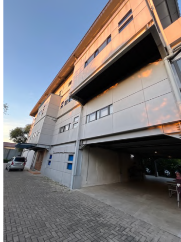
Gambar 2. 1 PT. Acom Digital Kreasi