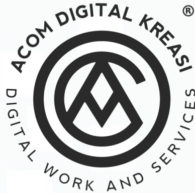
Gambar 2. 2 Logo Acom Digital Kreasi

Terdapat beberapa klien yang dipegang oleh Acom seperti Adira Finance, Burgari, MilaD'Opiz, Harmony, Lervia, Geliga, Sunco dan masih banyak lagi