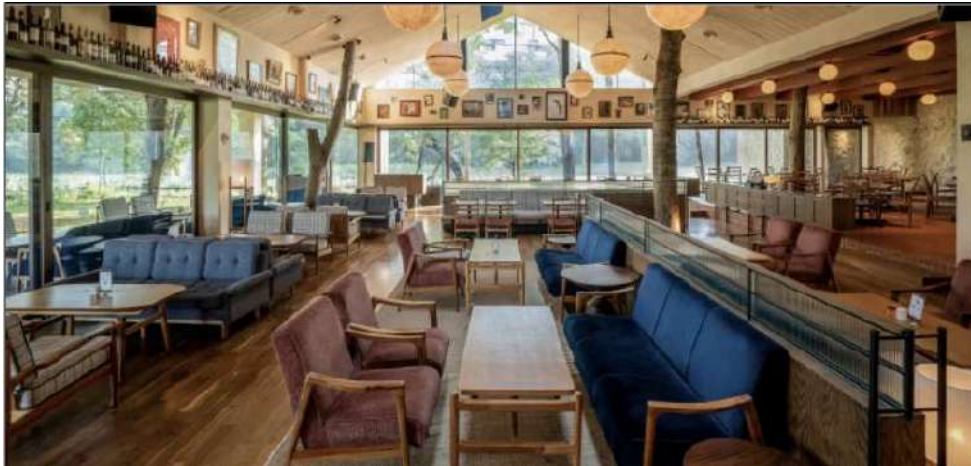
Gambar 2. 5 Acta Brasserie Senayan