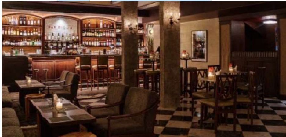
Gambar 2. 8 Miglia Cocktail Bar Senopati

Black Pond Tavern memperkuat portofolio Biko Group dengan menambahkan dimensi baru yang berfokus pada pengalaman minum yang nostalgik dan klasik. Keberhasilannya menunjukkan kemampuan Biko Group untuk menciptakan konsep bar yang unik dan berbeda dari yang lain, memenuhi kebutuhan dan selera yang beragam dari pelanggan. Black Pond Tavern juga memperkuat reputasi Biko Group sebagai penyedia layanan hospitality yang inovatif dan dinamis.