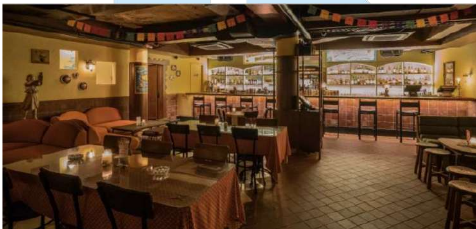
Gambar 2. 9 Cantinero Senopati

Sejak pembukaannya, Miglia Cocktail Bar telah menjadi salah satu destinasi bar yang populer di Senopati. Dengan reputasi untuk menyajikan koktail berkualitas tinggi dalam suasana yang eksklusif, bar ini terus menarik perhatian pengunjung lokal maupun wisatawan. Miglia Cocktail Bar terus berinovasi dengan menambahkan menu minuman baru dan mengadakan acara-acara khusus untuk meningkatkan pengalaman pengunjung.