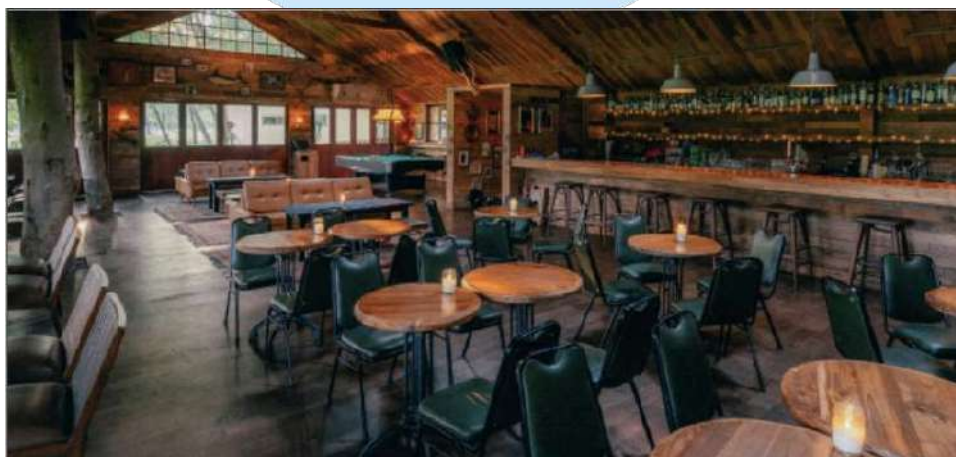
Gambar 2. 7 Black Pond Tavern Senayan

Acta Brasserie berkontribusi signifikan terhadap portofolio Biko Group dengan menambahkan dimensi kuliner yang lebih formal dan elegan. Keberhasilannya dalam menciptakan pengalaman bersantap sepanjang hari yang berkualitas menunjukkan kemampuan Biko Group untuk mengelola berbagai jenis restoran yang memenuhi kebutuhan dan selera yang beragam dari pelanggan. Acta Brasserie juga memperkuat reputasi Biko Group sebagai penyedia layanan hospitality yang unggul dan inovatif.