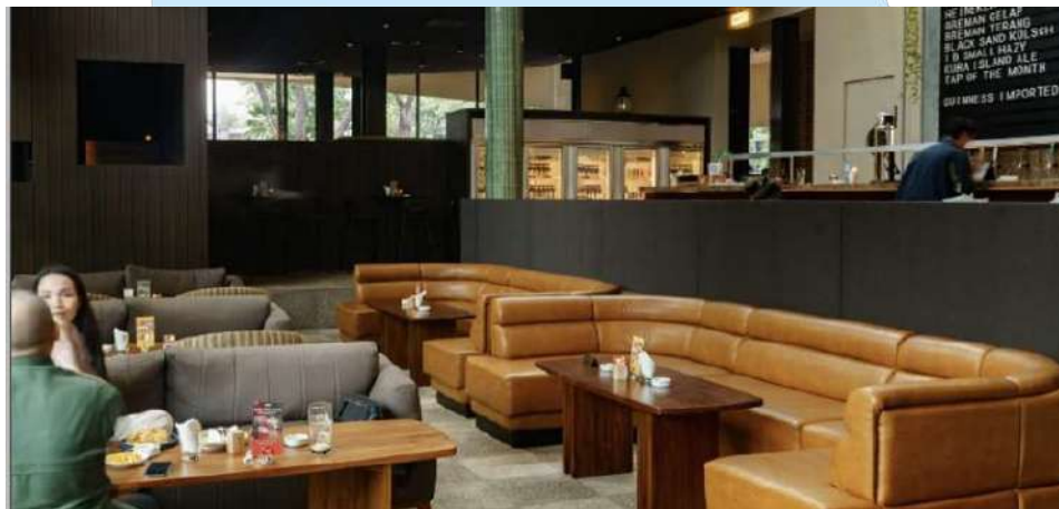
Gambar 2. 2 Beer Garden+ SCBD

Keberhasilan awal Beer Garden menjadi landasan kuat bagi pendirian Biko Group pada tahun 2012. Terinspirasi oleh kesuksesan konsep ini, Biko Group mengadopsi filosofi yang serupa dalam mengembangkan outlet-outlet berikutnya, dengan menekankan suasana yang ramah, inklusif, dan pengalaman positif bagi pelanggan. Beer Garden kemudian berkembang dengan membuka cabang-cabang baru di lokasi-lokasi strategis di Jakarta dan sekitarnya. Setiap cabang tetap mempertahankan prinsip dasar yang membuat Beer Garden diminati: harga bir terjangkau, suasana santai, dan layanan yang ramah. Penambahan seperti taman hijau dan musik live juga turut meningkatkan daya tarik tempat ini.