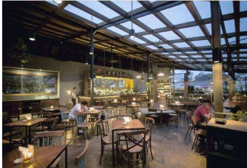
Gambar 2. 1 Beer Garden Radio Dalam