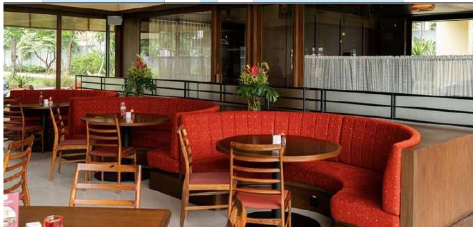
Gambar 2. 6 Acta Brasserie Gading Serpong