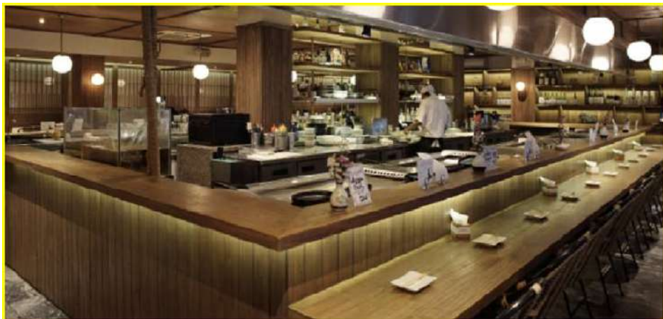
Gambar 2. 3 Fujin Izakaya Senopati

Sejak dibuka, Beer Garden+ telah menjadi salah satu destinasi favorit di SCBD bagi mereka yang mencari tempat untuk bersantai setelah bekerja, mengadakan pertemuan bisnis informal, atau sekadar berkumpul dengan teman-teman. Lokasinya yang strategis dan konsepnya yang unik membuat Beer Garden+ selalu ramai dikunjungi, terutama pada malam hari dan akhir pekan. Beer Garden+ tidak hanya melanjutkan kesuksesan dari konsep asli Beer Garden tetapi juga memperkuat posisi Biko Group sebagai pemimpin di industri hospitality di Indonesia. Dengan menawarkan pengalaman bersantai yang lebih premium namun tetap terjangkau, Beer Garden+ berhasil memperluas basis pelanggan Biko Group dan meningkatkan citra perusahaan sebagai inovator di bidang kuliner dan hiburan.