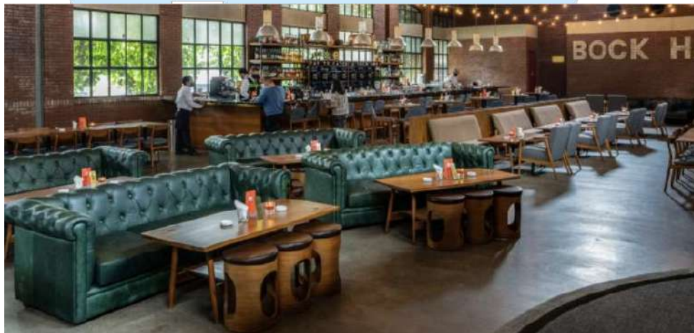
Gambar 2. 10 Beer Hall SCBD

Sejak pembukaannya, Cantinero telah menjadi salah satu destinasi malam yang populer di kota ini. Dengan reputasi untuk menyajikan koktail berkualitas tinggi dan suasana yang menggembirakan, kantina ini terus menarik perhatian dan mendapatkan ulasan positif dari para pengunjung. Cantinero terus berinovasi dengan menambahkan menu minuman baru dan mengadakan acara-acara khusus untuk memperkaya pengalaman pengunjung. Melalui kontribusinya yang beragam dalam pengayaan portofolio, penargetan demografis yang berbeda, inovasi dalam minuman dan hidangan, serta penguatan citra merek, Cantinero memberikan nilai tambah yang signifikan pada Biko Group. Ini menciptakan peluang untuk pertumbuhan dan kesuksesan jangka panjang perusahaan dalam industri hiburan dan layanan makanan dan minuman.