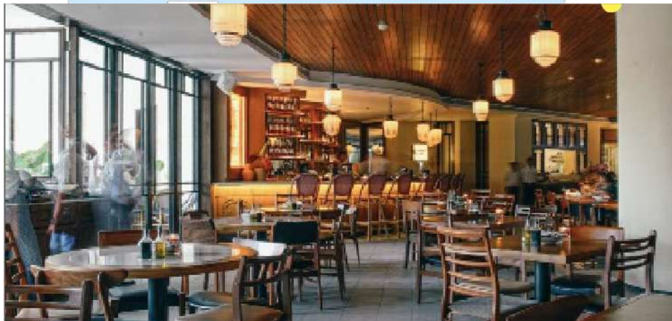
Gambar 2. 11 Pippo Italiano Senayan

Sejak pembukaannya, Beer Hall telah menjadi salah satu destinasi yang populer di kota ini. Dengan reputasi untuk menyajikan bir dan minuman beralkohol berkualitas tinggi dalam suasana yang menyenangkan, tempat ini terus menarik perhatian pengunjung lokal maupun wisatawan. Beer Hall terus berinovasi dengan menambahkan pilihan minuman baru dan mengadakan acara-acara khusus untuk memperkaya pengalaman pengunjung. Dengan dedikasi terhadap kualitas minuman dan atmosfer yang menyenangkan, Beer Hall terus menjadi tempat yang dicari bagi pecinta bir dan minuman beralkohol.