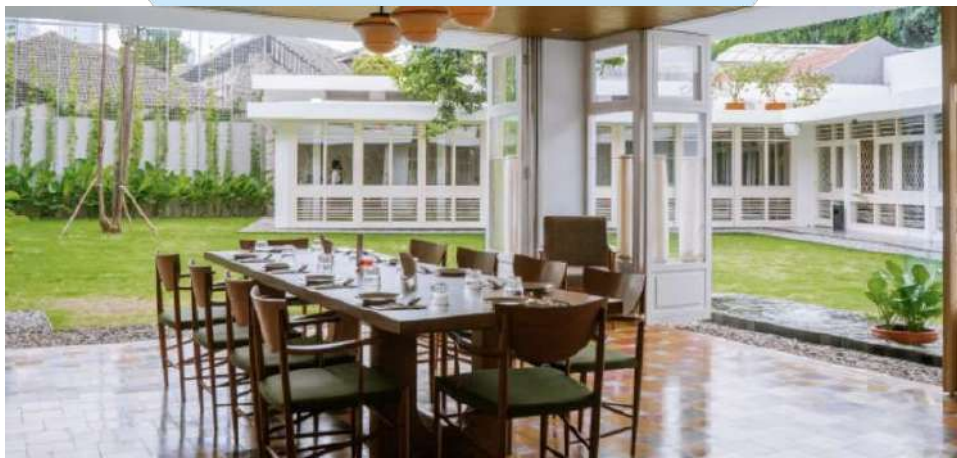
Gambar 2. 12 Silk Bistro Menteng

Sejak pembukaannya, Pippo Italiano telah menjadi salah satu destinasi kuliner Italia yang populer di kota ini. Dengan reputasi untuk menyajikan hidangan Italia yang otentik dan berkualitas tinggi, restoran ini terus menarik perhatian pengunjung lokal maupun wisatawan. Pippo Italiano terus berinovasi dengan menambahkan menu baru dan mengadakan acara-acara khusus untuk memanjakan para pelanggan. Melalui dedikasinya terhadap kualitas, kesederhanaan, dan sentuhan rumah dalam hidangannya, Pippo Italiano terus menjadi tempat yang dicari bagi para penggemar kuliner Italia.