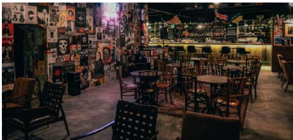
Gambar 2. 4 Duck Down Bar Senopati

Fūjin memperkuat portofolio Biko Group dengan menambahkan dimensi kuliner Jepang yang autentik dan berkualitas tinggi. Keberhasilan Fūjin menunjukkan kemampuan Biko Group untuk mengelola berbagai konsep restoran yang berbeda, masing-masing dengan daya tarik uniknya. Pengalaman dan standar tinggi yang diterapkan di Fūjin juga berkontribusi pada reputasi keseluruhan Biko Group sebagai penyedia layanan hospitality yang unggul.