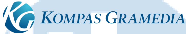
Gambar 2.2 Logo Kompas Gramedia