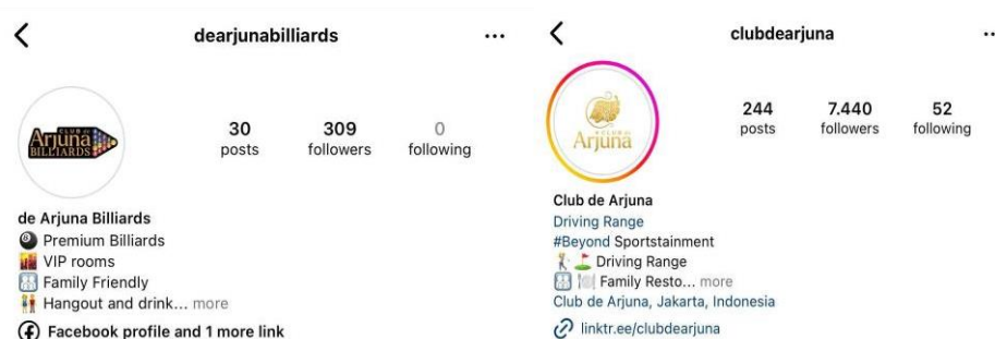
Gambar 2. 2 Akun Instagram De Arjuna Billiards & Club De Arjuna

Club de Arjuna memanfaatkan media sosial sebagai salah satu alat utama dalam kegiatan promosinya. Hal ini dapat dilihat dari kedua akun Instagram yang dimilikinya, baik untuk golf maupun billiard . Melalui hal tersebut, Club de Arjuna memberikan akses kepada pengguna media sosial untuk memperoleh informasi terkini mengenai berbagai kegiatan, promosi, serta acara yang diselenggarakan.