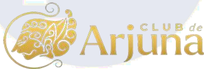
Gambar 2. 1 Logo Club de Arjuna

Orang Tua Group adalah perusahaan multinasional yang berbasis di Indonesia. Dengan sejarah panjang yang mencapai puluhan tahun, Orang Tua Group telah tumbuh menjadi salah satu pemain utama di berbagai sektor industri, termasuk makanan dan minuman, kesehatan, kecantikan, dan produk konsumen lainnya. Didirikan pada tahun 1948 oleh seorang pengusaha visioner, Orang Tua Group telah menjadi simbol keberhasilan dan inovasi di pasar domestik dan internasional.