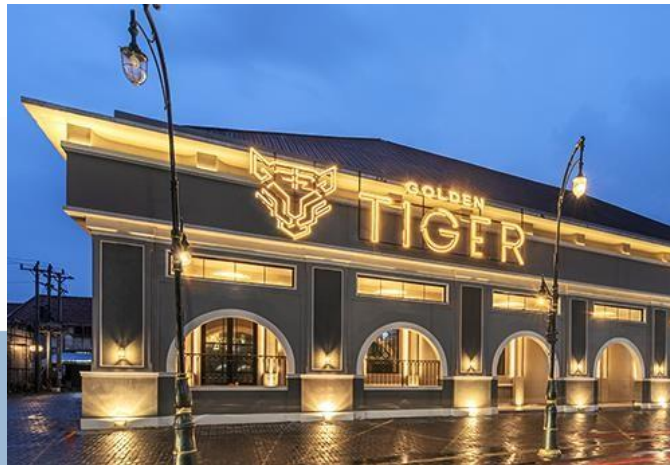
Gambar 2. 3 Outlet Golden Tiger