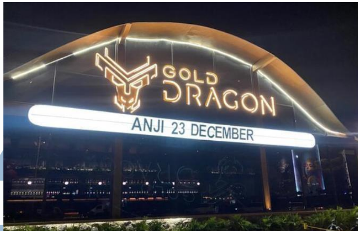
Gambar 2. 2 Outlet Gold Dragon