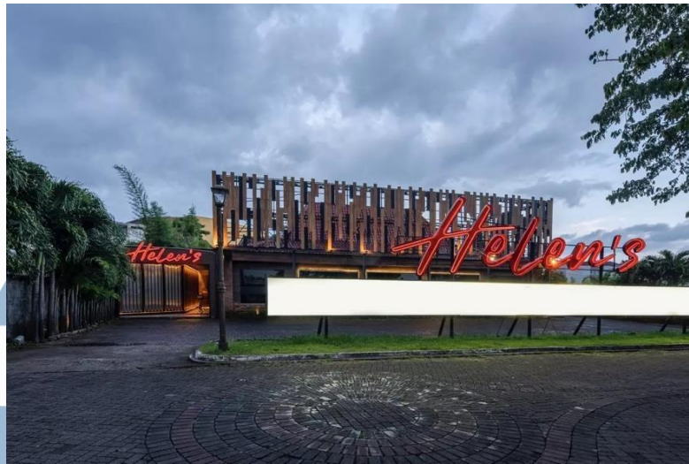
Gambar 2. 1 Outlet Helen's