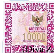
(Diva Zahra Azarine)