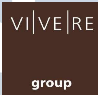
Gambar 2.1 Logo VIVERE Group

Memulai perjalanannya dengan nama PT Gema Graha Sarana (GGS) ketika awal didirikan pada tanggal 7 Desember 1984, VIVERE Group merupakan perusahaan yang bergerak di industri furnitur dan memiliki beberapa lini bisnis mulai dari manufaktur, home furnish , interior contractor , distribusi dan ekspor. Menginjak di usia 40 tahun VIVERE Group terus-menerus mengembangkan perusahaan dengan melakukan inovasi untuk memenuhi kebutuhan interior Masyarakat atau dikenal dengan istilah one-stop-solution .