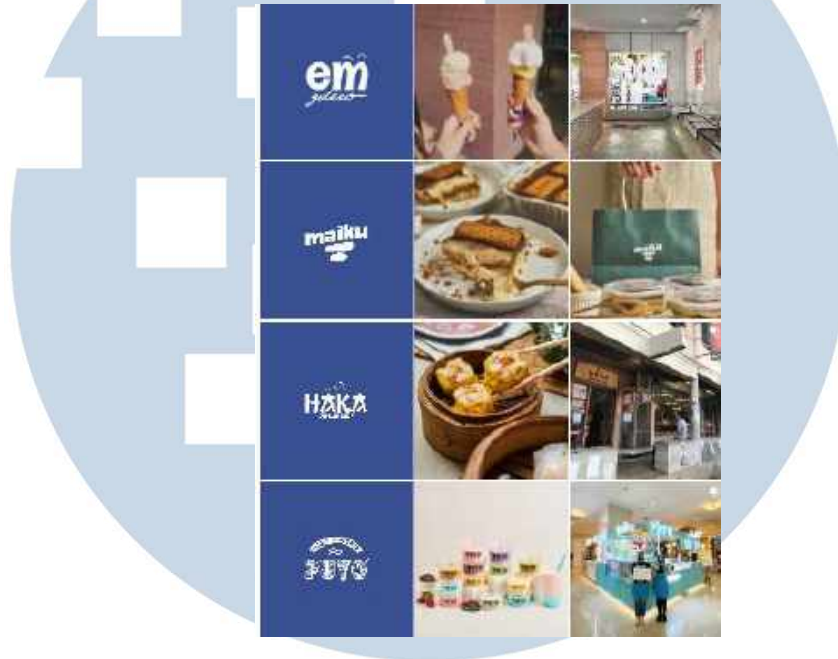
Gambar 2.3 Brand-brand di bawah naungan Puyo Group

perusahaan. Puyo Desserts memiliki beberapa brand dibawah naungannya yaitu Haka Dimsum, Maiku Tiramisu, dan EM Gelato, dimana seluruh brand tersebut bergerak di bidang food & beverage dibawah naungan Puyo Group.