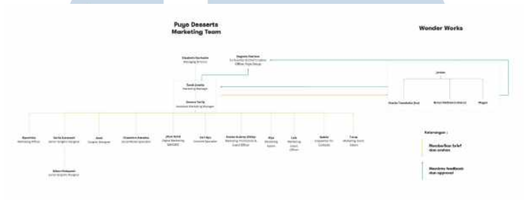
Gambar 2.5 Struktur Puyo Group Marketing Team

Gambar berikut adalah bagan struktur organisasi Puyo Group Marketing Team secara keseluruhan.