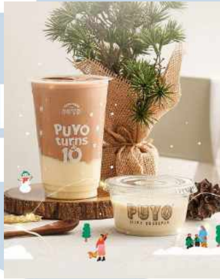
Gambar 2.2 Foto Silky Desserts dan Silky Drink

usia, dari anak kecil hingga orang tua. Sementara itu, produk lainnya yaitu Silky Drinks menyediakan pilihan minuman manis dan menyegarkan yang dapat dinikmati bersama Silky Dessert.