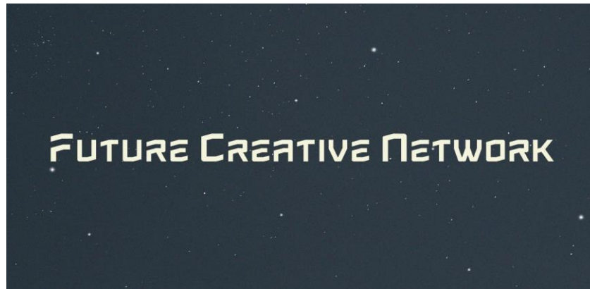
Gambar 2.1 Logo Future Creative Network