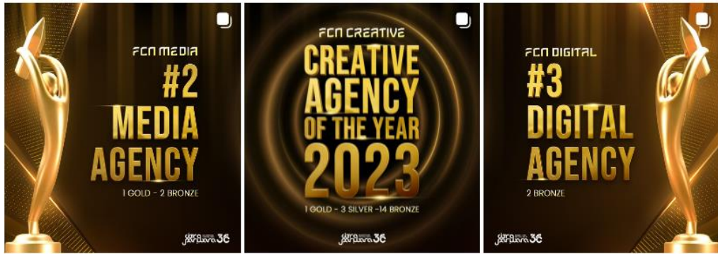
Gambar 2.2 Pencapaian FCN di Citra Pariwara 2023

Pada tahun lalu, FCN telah berhasil menjadi Creative Agency Of The Year dengan meraih total penghargaan 1 Gold , 3 Silver , dan 14 bronze pada kampanye-kampanye iklan yang dikeluarkannya. FCN Media juga meraih peringkat kedua dengan meraih total penghargaan 1 gold dan 2 bronze . Terakhir, FCN Digital berhasil menempati peringkat ketiga dengan mendapatkan 2 bronze .