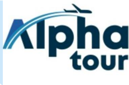
Gambar 2.3 Logo Alpha Tour

Alpha Tour merupakan penyedia layanan jasa pariwisata dengan paket tour mulai dari tiket pesawat, hotel, bus, dan lain-lain. Awal mula Alpha Tour berdiri pada tahun 2015 dengan nama Icon Travel Service. Namun, pada tahun 2020 mereka re-branding dengan nama baru, yaitu Alpha Tour.