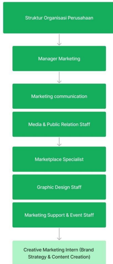
Gambar 2. 3 Struktur Departemen Marketing