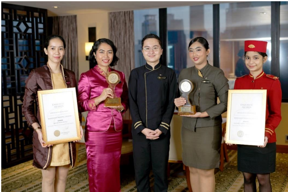
Gambar 2.2 Penghargaan Exquisite 'Best Business Hotel' 2023

Pelayanan yang diberikan kepada konsumen dengan konsisten dapat terlihat dari berbagai penghargaan yang diperoleh. Mandarin Oriental Hotel Jakarta memperoleh penghargaan pada tahun 2023 dari Exquisite Awards sebagai ‘ Best Business Hotel ’ di Indonesia. Beragam kegiatan meetings, incentives, convention, and exhibition (MICE) yang diadakan di hotel ini yang disertai oleh kualitas pelayanan sempurna yang diberikan membuat Mandarin Oriental Hotel Jakarta mampu memperoleh penghargaan tersebut.