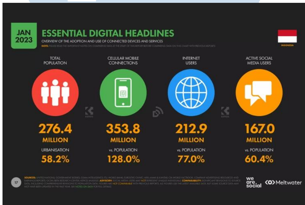
Gambar 2.3 Essential Digital Headliners Indonesia

Mandarin Oriental Hotel Jakarta juga memperoleh penghargaan yang berasal dari Expedia Group yaitu ‘ Top Guest Review Jakarta ’ pada tahun 2023 yang menunjukkan bahwa tamu yang telah menikmati pelayanan dari Mandarin Oriental Hotel Jakarta cenderung memuaskan. Berbagai jenis penghargaan yang telah diperoleh oleh Mandarin Oriental Hotel Jakarta tersebut menunjukkan bahwa hotel ini dapat terus menjaga kualitas properti maupun pelayanan yang diberikan secara keseluruhan. Hal tersebut menjelaskan mengapa Mandarin Oriental Hotel Jakarta tetap dipercayai dan menjadi pilihan konsumen sebagai salah satu hotel terbaik yang berlokasi di Jakarta. Kredibilitas yang dimiliki oleh salah satu hotel ikonik yang berlokasi di Jakarta Pusat ini membuat eksistensinya terus berlangsung walaupun banyak bermunculan hotel-hotel baru berbintang lima maupun yang berbintang lebih rendah.