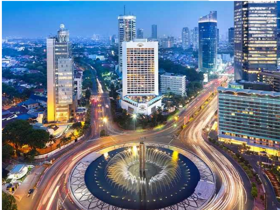
Gambar 1.1 Gedung Mandarin Oriental Hotel Jakarta

sempurna di pusat kota Jakarta yaitu di Bundaran HI serta dikelilingi oleh gedung properti ternama.