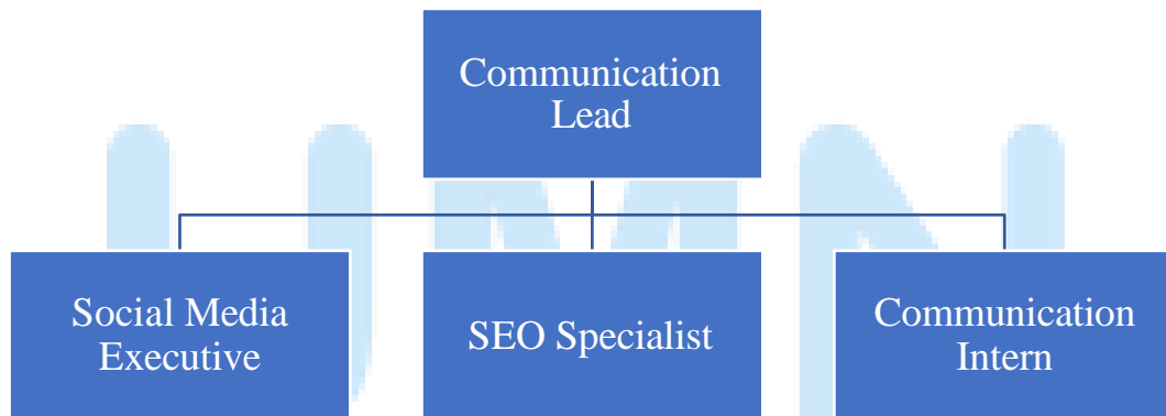
Gambar 2. 4 Struktur Departemen Komunikasi

Bertanggung jawab dalam mengawasi perancangan tampilan website perusahaan dan menjaga performa website agar dapat berjalan maksimal. Seorang Development Lead juga bertanggungjawab untuk mengatasi segala bug yang terdapat dalam website .