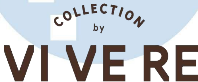
Gambar 2. 2 Logo Collection by VIVERE Sumber: Graphic Designer Collection by VIVERE

PT Vivere Multi Kreasi (VMK) merupakan salah satu anak perusahaan milik VIVERE Group yang mendukung pengimplementasian ketiga nilai tersebut. PT Vivere Multi Kreasi (VMK) telah berdiri dari tahun 2003 dan memiliki reputasi baik di masyarakat Indonesia maupun internasional. PT VMK sendiri memiliki dua brand di bawahnya, yakni Collection by VIVERE dan IDEMU by VIVERE. Kedua brand tersebut memiliki spesialisasi pada furniture . IDEMU by VIVERE menyediakan custom dan loose furniture , sedangkan Collection by VIVERE menyediakan furniture dengan kualitas premium dan berbagai macam home accessories .