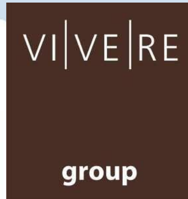
Gambar 2. 1 Logo VIVERE Group Sumber: (VIVERE Group, n.d.)

VIVERE Group merupakan perusahaan yang bergerak di bidang kontraktor interior dengan nama perusahaan PT Gema Graha Sarana (GGS) yang berdiri pada tahun 1984. VIVERE Group memiliki beberapa business unit yang bergerak dalam bidang manufaktur, layanan jasa pada bidang interior, home furnishing , distribusi hingga ekspor. Dengan 3 dekade lebih pengalaman, VIVERE Group telah memiliki jalinan kerja sama yang luas dengan beberapa kantor, hotel, apartemen, dan retail. Selain itu, VIVERE Group juga sangat dikenal dan dipercaya baik oleh masyarakat di Indonesia sendiri maupun perusahaan luar negeri. Untuk mendukung promosi dan pengalaman langsung oleh klien, VIVERE Group menyediakan showroom untuk mempromosikan layanan serta produk yang dimilikinya.