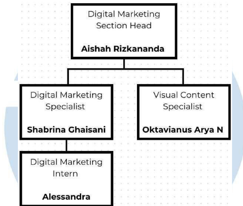
Gambar 2. 4 Struktur Perusahaan Digital Marketing

Berdasarkan struktur organisasi yang tertera, masing-masing peran memiliki tugas dan tanggung jawabnya masing-masing, sebagai berikut: