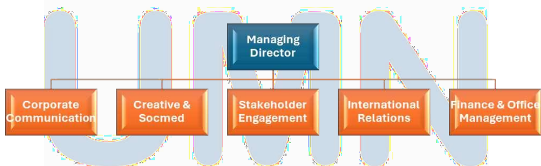
Gambar 2.1 Struktur Organisasi Sinar Mas President Office

Sinar Mas adalah perusahaan yang telah beroperasi selama delapan puluh enam tahun, didirikan pada tahun 1938. Salah satu unit bisnis non-pilarnya adalah Sinar Mas President Office, yang bergerak di bidang holding company dan corporate secretary dengan struktur organisasi sebagai berikut: