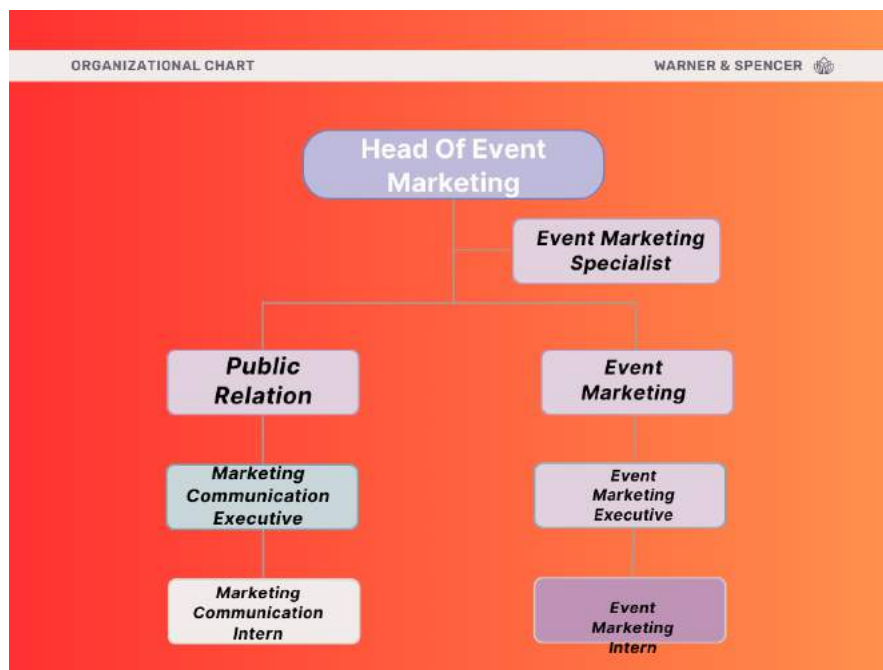
Gambar 2.3 Struktur Organisasi Departemen Marketing Communication

Sebagai perusahaan dengan berbagai program bisnis, keberadaan departemen marketing communication sangatlah krusial. Departemen ini bertanggung jawab untuk meningkatkan kesadaran merek dan keterlibatan pelanggan PergiKuliner melalui penyelenggaraan berbagai kegiatan dan acara.