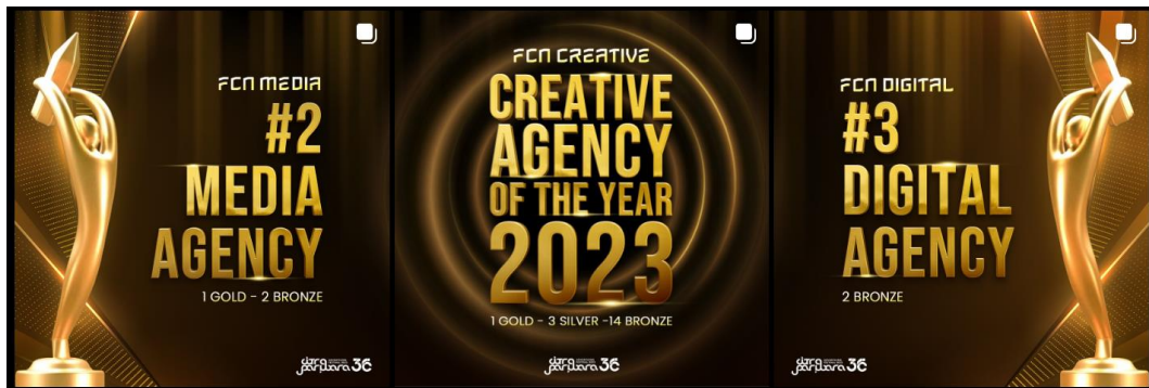
Gambar 2.2 Penghargaan Future Creative Network pada 2023

penghargaan sebagai agency of the year dari Citra Pariwara pun terus didapatkan dan FCN tidak pernah absen dari penghargaan tersebut.