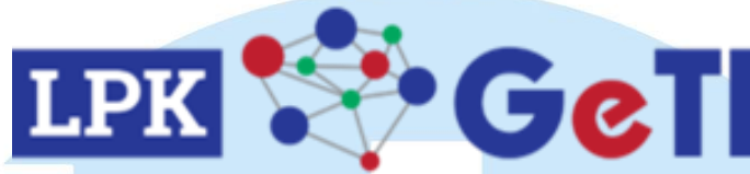
Gambar 2.1 Logo LPK Geti