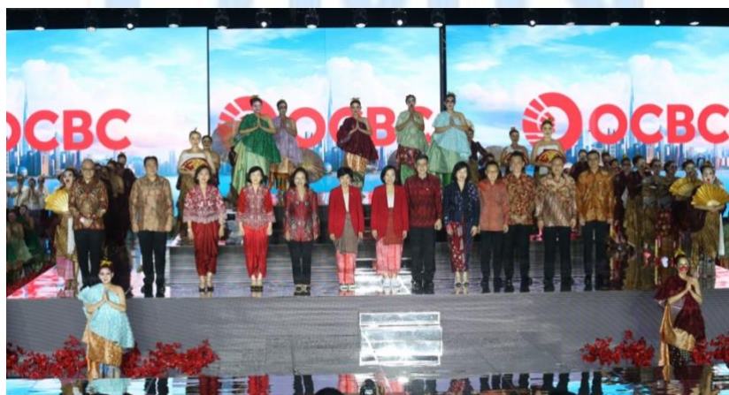
Gambar 2.2 OCBC NISP rebrands to OCBC

Seluruh perkembangan Bank NISP tidak berhenti disana karena pencapaian baru terus bermunculan. Pada Tahun 1997 OCBC Bank asal Singapura menetapkan Bank NISP sebagai partner lokal mereka dan kemudian pada Tahun 2005 OCBC Singapura mulai menaikkan kepemilikan saham di Bank NISP yang akhirnya berhasil membuat Bank NISP mengganti nama pada 2008 menjadi “Bank OCBC NISP” sebagai tanda citra baru dan juga dukungan controlling shareholder . Bukan hanya itu, OCBC Bank asal Singapura juga melakukan penggabungan anak perusahaannya dengan Bank OCBC NISP sehingga hal ini menjadi tonggak sejarah yang sangat penting karena tentunya terjadi strategi serta penyesuaian budaya perusahaan yang baru. Adapun budaya perusahaan tersebut yang masih dipegang dan menjadi pedoman sampai sekarang yakni Bank OCBC NISP One, Professionalism, Integrity dan Customer atau disingkat One PIC.