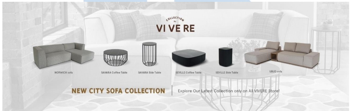
Gambar 2. 2 produk dari Collection by VIVERE

menghadirkan produk furnitur, Collection by VIVERE juga menghadirkan dekorasi & Aksesoris rumah seperti Jam, Hampers, bahkan parfum ruangan untuk menghiasi dan memberikan atmosfer yang segar pada rumah.