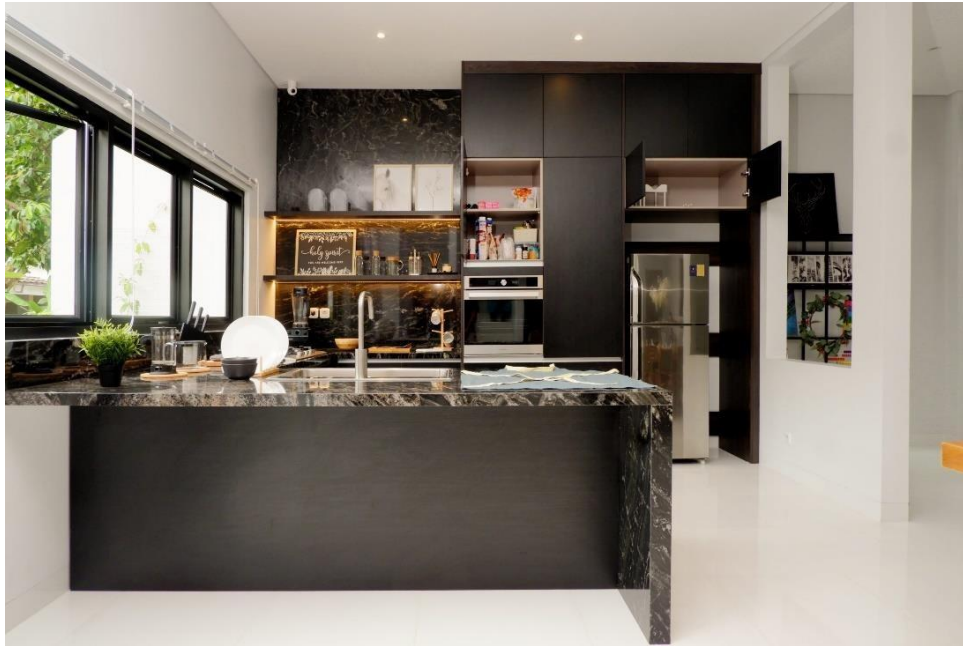
Gambar 2. 3 Kitchen Set from IDEMU