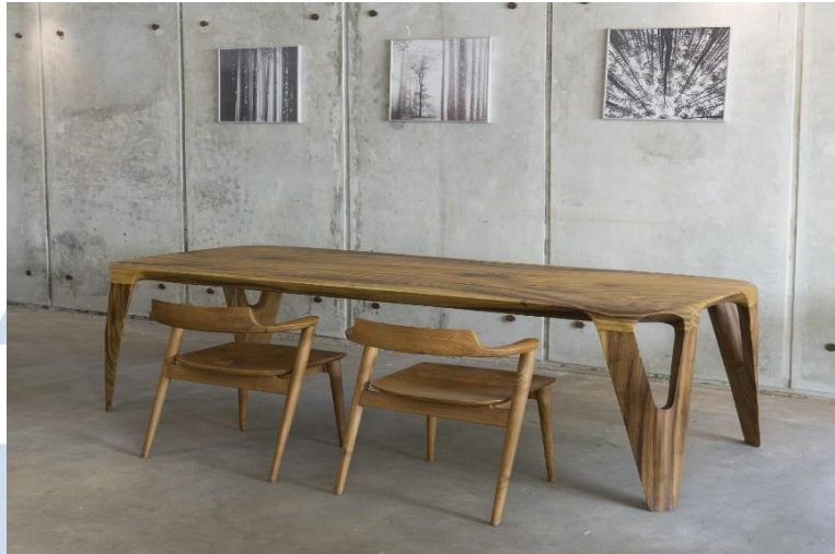
Gambar 2. 4 SIL Dining Chair – CASAKA