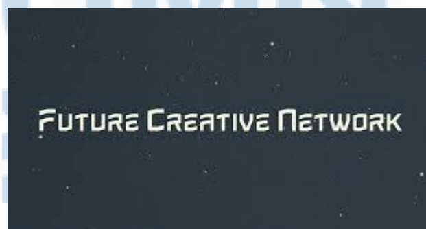
Gambar 2. 1 Logo Future Creative Network