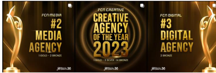
Gambar 2. 3 Penghargaan Citra Pariwisata Future Creative Network