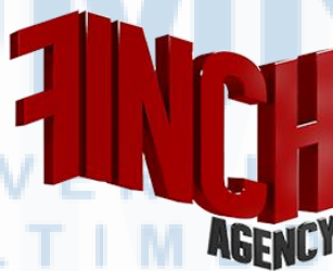
Gambar 2. 4 Logo Finch Agency

Seperti apa yang dinyatakan oleh penulis, Future Creative Network merupakan suatu ekosistem kreatif yang memiliki jejaring yang luas sehingga terdapat banyak nama perusahaan di bawahnya yang turut serta mengambil peran. Berikut adalah perusahaan-perusahaan atau unit-unit bisnis yang dimiliki oleh Future Creative Network . Di dalamnya terdapat salah satu creative advertising agency yang menjadi tempat dimana penulis bekerja yaitu Finch Agency .