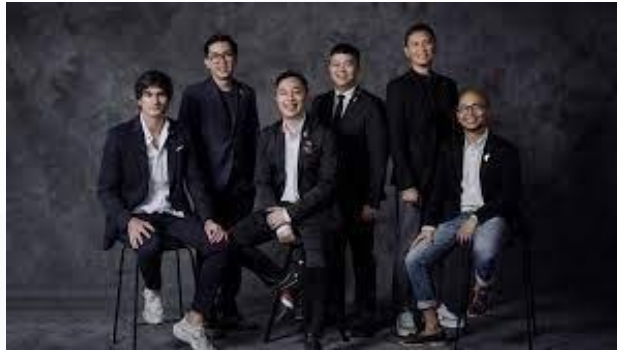
Gambar 2. 2 CEO Future Creative Network