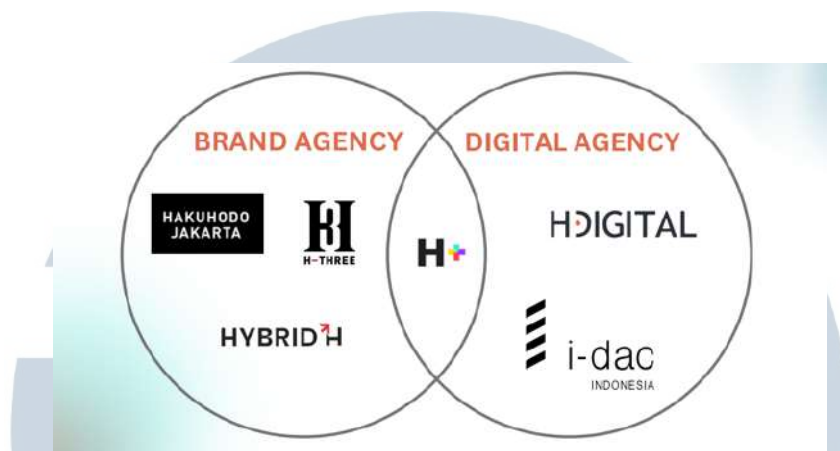
Gambar 2.2 Struktur HakuHodo Indonesia

Berdasarkan situs perusahaan HakuHodo Jakarta, HakuHodo berdiri di Indonesia sejak tahun 2003 dan dicetuskan oleh Irfan Ramli, dengan tujuan untuk meningkatkan dan membangun dunia periklanan di Indonesia. Saat ini HakuHodo Indonesia telah memiliki banyak lini usaha yang terdiri dari 6 perusahaan, seperti HakuHodo Jakarta, H Three, Hybrid H, H plus, HDigital dan I-Dac Indonesia. Situs Liputan 6 menjelaskan bahwa terdapat banyak penghargaan yang telah dikumpulkan dan didapatkan oleh HakuHodo Indonesia. Beberapa penghargaan yang diraih adalah penghargaan Citra Pariwisata pada tahun 2016 dari kategori Advertising Agency of The Year 2016 , Media Agency of the Year 2016 , mendapatkan Gold, Silver, Bronze dalam kategori Mob-Ex Awards 2020 , dan masih banyak lainnya.