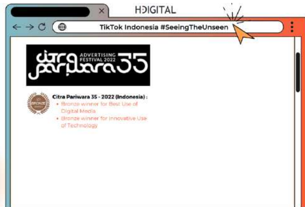
Gambar 2.6 Penghargaan CPI TikTok Hakuhodo Digital

Selanjutnya, Hakuhodo Digital juga mendapatkan penghargaan dalam ajang Citra Pariwara TikTok, dengan mendapatkan Bronze Winner pada 2 kategori. Tentunya Hakuhodo Digital terus mengembangkan dan memaksimalkan keahlian yang dimiliki agar dapat menghasilkan sebuah karya yang baik dan maksimal.