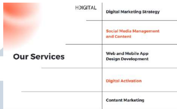
Gambar 2.3 Layanan Hakuodo Digital

Hakuodo Digital merupakan salah satu unit bisnis yang dimiliki oleh Hakuodo Indonesia yang memiliki spesialisasi dan berfokus terhadap digital. Hakuodo Digital merupakan agensi yang memberikan layanan full terhadap digital marketing agency , digital insight , design , social media dan marketing . Hakuodo Digital memiliki beberapa motto seperti People Centered , Data Driven , dan Global Communications .