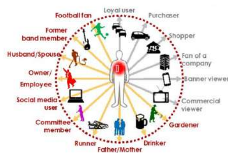
Gambar 2.8 Sei-Katsu-Sha

Sei-Katsu-Sha merupakan filosofi yang digunakan oleh seluruh lini bisnis dari Hakuodo. Sei-Katsu-Sha memiliki arti sebagai “orang yang hidup”, filosofi ini menjelaskan bahwa perusahaan tidak hanya memiliki sudut pandang bahwa pelanggan hanyalah seorang konsumen, melainkan menganggap bahwa pelanggan merupakan makhluk yang holistik dan memiliki kehidupan.