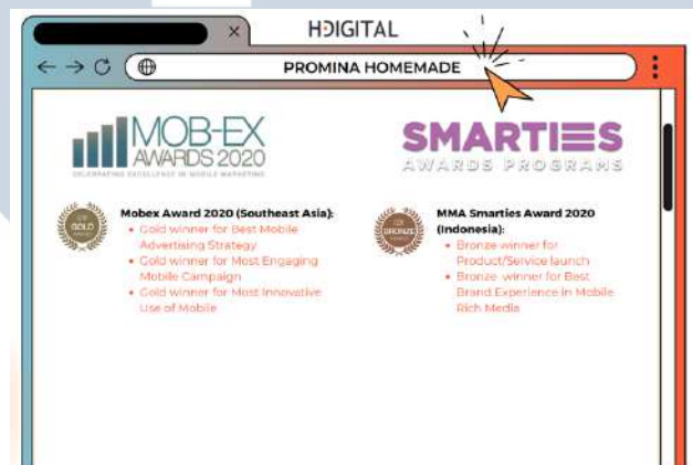
Gambar 2.5 Penghargaan Mob-Ex Promina Homemade HakuHodo Digital

2020 ( Southeast Asia ), dan masih banyak penghargaan lainnya. Penghargaan tersebut dikumpulkan dan didapatkan dari proyek-proyek yang telah dikerjakan sebelumnya dari beberapa klien yang berasal dari perusahaan besar di Indonesia. Salah satu penghargaan yang berhasil dikumpulkan oleh HakuHodo saat bermitra dengan Telkomsel adalah, sukses untuk mendapatkan penghargaan dalam Mob-Ex Awards tahun 2020, dengan mengumpulkan Gold Winner , Silver Winner , dan juga Bronze Winner untuk beberapa kategori. Terakhir, HakuHodo berhasil mendapatkan penghargaan dalam Citra Pariwisata tahun 2019, dengan mendapatkan gelar Bronze Winner .