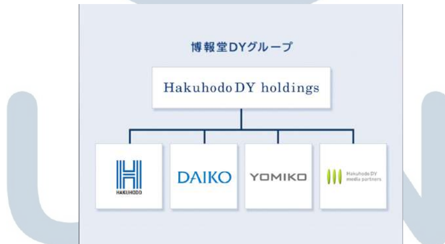
Gambar 2.1 Struktur Hakuodo

Tushnet dan Goldman (2019) Menjelaskan bahwa Periklanan merupakan sebuah komunikasi yang persuasif, berbayar, dan memiliki sponsor dan dilakukan di media massa, sehingga dapat menjangkau masyarakat secara luas. Situs Hakuodo Global menyatakan bahwa Hakuodo merupakan agensi periklanan yang telah hadir sejak 1895 pada bulan Oktober yang didirikan oleh Hironao Seki di Kanda-Nabecho, Tokyo. Awalnya, Hakuodo merupakan perusahaan perantara antara ruang iklan dan untuk majalah pendidikan. Namun, seiring berjalannya waktu Hakuodo berhasil mendirikan departemen periklanan dan saat ini berhasil memiliki lebih dari 150 kantor yang tersebar di 120 negara dan masuk ke dalam peringkat 10 perusahaan pemasaran secara global.