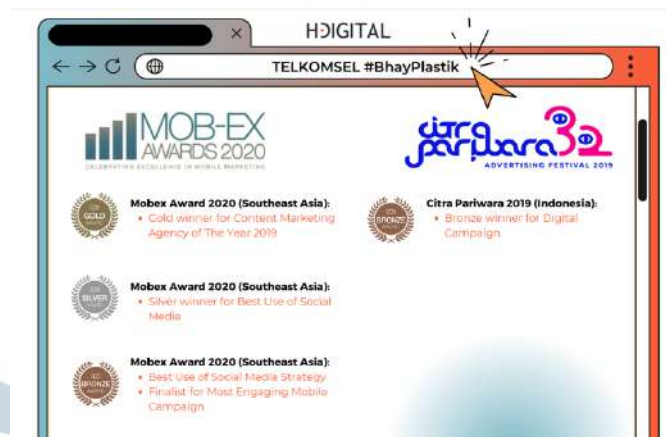
Gambar 2.4 Penghargaan Mob-Ex Telkomsel Hakuodo Digital

Hakuodo Digital merupakan salah satu unit bisnis yang dimiliki oleh Hakuodo Indonesia yang memiliki spesialisasi dan berfokus terhadap digital. Hakuodo Digital merupakan agensi yang memberikan layanan full terhadap digital marketing agency , digital insight , design , social media dan marketing . Hakuodo Digital memiliki beberapa motto seperti People Centered , Data Driven , dan Global Communications .