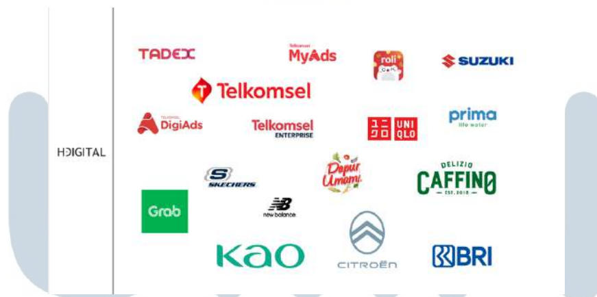
Gambar 2.7 Klien Hakuhodo Digital

Selanjutnya, Hakuhodo Digital juga mendapatkan penghargaan dalam ajang Citra Pariwara TikTok, dengan mendapatkan Bronze Winner pada 2 kategori. Tentunya Hakuhodo Digital terus mengembangkan dan memaksimalkan keahlian yang dimiliki agar dapat menghasilkan sebuah karya yang baik dan maksimal.