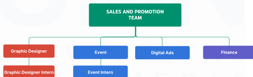
Gambar 2.5 Struktur Organisasi Sales and Promotion Team Commercial BSD

Selama proses kerja magang, penulis bekerja di dalam sales and promotion team yang bertanggung jawab dalam melakukan brainstorming terhadap strategi pemasaran yang dapat mendukung terjadinya penjualan produk. Serta nantinya juga berperan sebagai eksekutor dalam melaksanakan program-program Commercial BSD . Khususnya, berkaitan dengan penjualan produk komersial yang dimiliki.