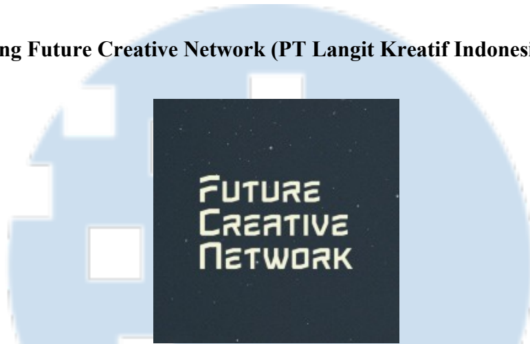
Gambar 2. 1 Logo PT Langit Kreatif Indonesia