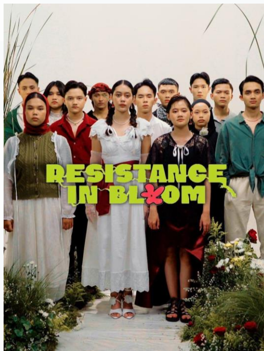
Gambar 2.2 Batch S.E "Resistance in Bloom"

Cretivox memiliki program Cretivox Internship Experience , konsep Internship Experience ini dimulai dari Batch 2 “ Story of A Lifetime ” yang berjumlah 6 orang. Kemudian pada Batch 3 “ The Forgotten ” sesuai namanya batch ini terlupakan, sehingga Batch 4 “ Unforgettable Experiences ” menjadi benchmark internship experience seutuhnya. Kemudian, konsep tersebut diterapkan kembali pada Batch 5 “ Be a Dreamer ” dan akhirnya terbentuk formula dari Cretivox Internship Experience yang kini sudah mencapai Batch S.E “ Resistance in Bloom ” posisi penulis saat ini.