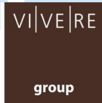
Gambar 2.1 Logo VIVERE Group

Pada mulanya VIVERE Group merupakan perusahaan yang bergerak di bidang kontraktor interior yang bernama PT Gema Graha Sarana (GGS). PT GGS Gema Graha Sarana (GGS) didirikan pada tahun 1984 dan telah beroperasi selama 40 tahun. Kini, VIVERE Group memiliki lebih dari 1500 karyawan di berbagai sektor serta memiliki 6 lini bisnis yang bergerak di bidang Interior & kontraktor MEP, manufaktur, furniture kantor dan komersial, retail furniture residential, distribusi material dan produk interior, hingga export .