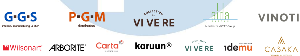
Gambar 2.2 Logo Unit Bisnis dan Merek VIVERE Group

VIVERE Group memiliki unit bisnis untuk menjalankan lini bisnis tertentu, supaya setiap aspek dapat dikerjakan dengan struktur dan tujuan yang terfokus. VIVERE Group saat ini menjalankan lini bisnis di bidang kontraktor interior & mechanical, electrical, plumbing (MEP), furnitur kantor, furnitur residensial, distribusi, ekspor, dan manufaktur. Setiap unit bisnis memiliki produk dan layanan yang berbeda untuk menyesuaikan dan menjadi solusi dari kebutuhan konsumen yang berbeda juga.