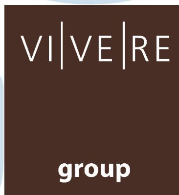
Gambar 2.1 Logo VIVERE Group

VIVERE Group berdiri sebagai perusahaan kontraktor interior pada 1984 dengan nama PT Gema Graha Sarana. Sudah berdiri hampir 40 tahun, VIVERE Group terus melakukan inovasi dan berkembang. Melalui media sosialnya, VIVERE Group memulai perusahaan dengan kurang dari 10 orang, saat ini VIVERE Group memiliki 6 lini bisnis, mengerjakan proyek lebih dari 3 juta meter persegi, 7 pabrik, ekspansi sampai ke lebih dari 25 negara, dan didukung oleh lebih dari 1,000 pekerja (viveregroup, 2024). VIVERE Group juga bekerja sama secara aktif dengan konsultan, firma, maupun organisasi lain untuk mengembangkan proyek dan dampak perusahaan. Sebagai perusahaan di industri furnitur, VIVERE Group menanamkan berbagai value baik untuk internal maupun eksternal. VIVERE Group tidak hanya berfokus untuk mengembangkan perusahaan, tetapi juga memberikan dampak dalam pertumbuhan industri furnitur di Indonesia.