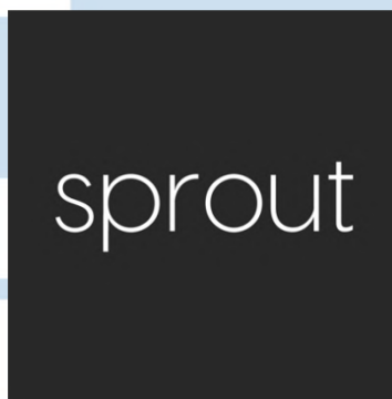
Gambar 2.1 Logo Sprout Digital

Brand Labamu mempercayai Sprout Digital untuk mengembangkan mereknya. Brand Labamu merupakan aplikasi kasir yang memiliki banyak sekali fitur-fitur untuk membantu para UMKM dalam menjalankan bisnisnya. Labamu telah dipercaya oleh 70.000 lebih UMKM di Indonesia. Dengan berbagai industri mulai dari Food & Beverage , freelancer , pengusaha fashion , dan lain-lain.