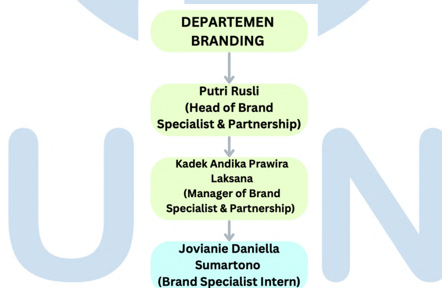
Gambar 2.4 Ruang Lingkup Divisi Branding

Bertugas untuk mengelola proses rekrutmen untuk mendapatkan karyawan yang berkualitas sesuai kebutuhan perusahaan. Melakukan pelatihan dan pengembangan untuk karyawan.