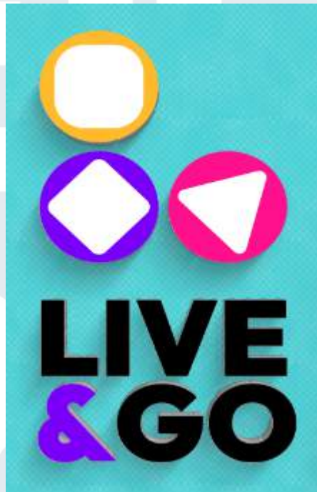
Gambar 2.1 Logo Live & Go