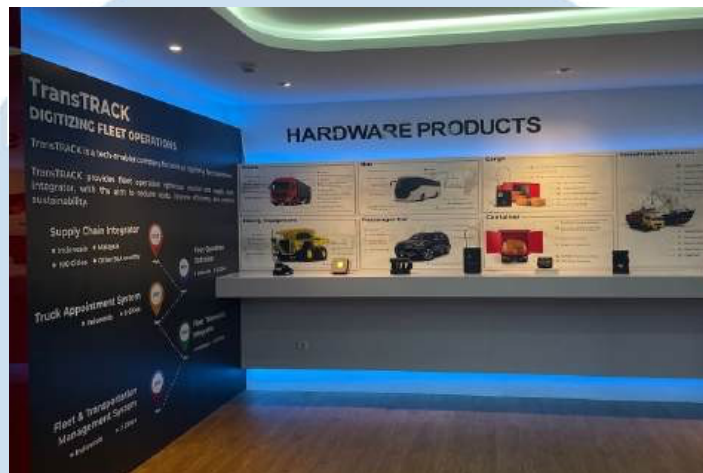
Gambar 2.1 Experience Center TransTRACK

logistik perusahaan lain. TransTRACK telah menjangkau 100 kota di Indonesia dan Malaysia, dengan target pasar Asia di tahun berikutnya.