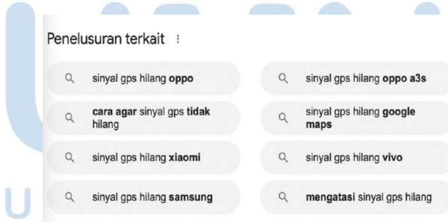
Gambar 3.2 Latent Semantic Indexing

Setelah melakukan analisa terhadap kata kunci yang akan digunakan, seorang SEO Content Creator akan menganalisa kompetitor dengan mencari kata kunci pada search bar Google dan media sosial untuk mengetahui keunggulan dan kekurangan dari konten mereka. Pada Google, analisa kompetitor dapat dilihat dari judul artikel, kelengkapan isi artikel, fitur “People Also Ask”, dan Latent Semantic Indexing . Pada tahap ini, peran SEO Content Creator akan lebih memperluas jangkauan dan ide untuk isi konten yang akan digunakan dalam artikel.