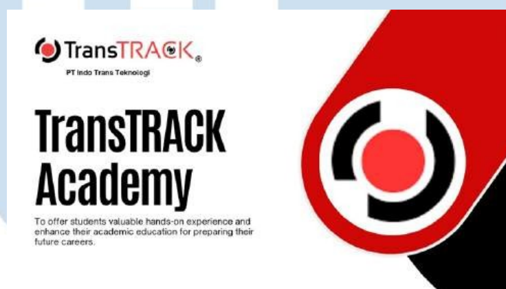
Gambar 3.4 Materi Webinar

tim, dan juga pembuatan materi yang akan digunakan pada event webinar yang akan mendatang dengan pembuatan Power Point Presentation, beserta dengan rekapan kasus atau berita yang dapat dikaitkan dengan TransTRACK. Menyebarluaskan broadcast mengenai webinar yang akan mendatang pada WhatsApp Official TransTRACK dengan menggunakan Mekari juga merupakan salah satu tugas yang dilakukan dalam tahap perencanaan.