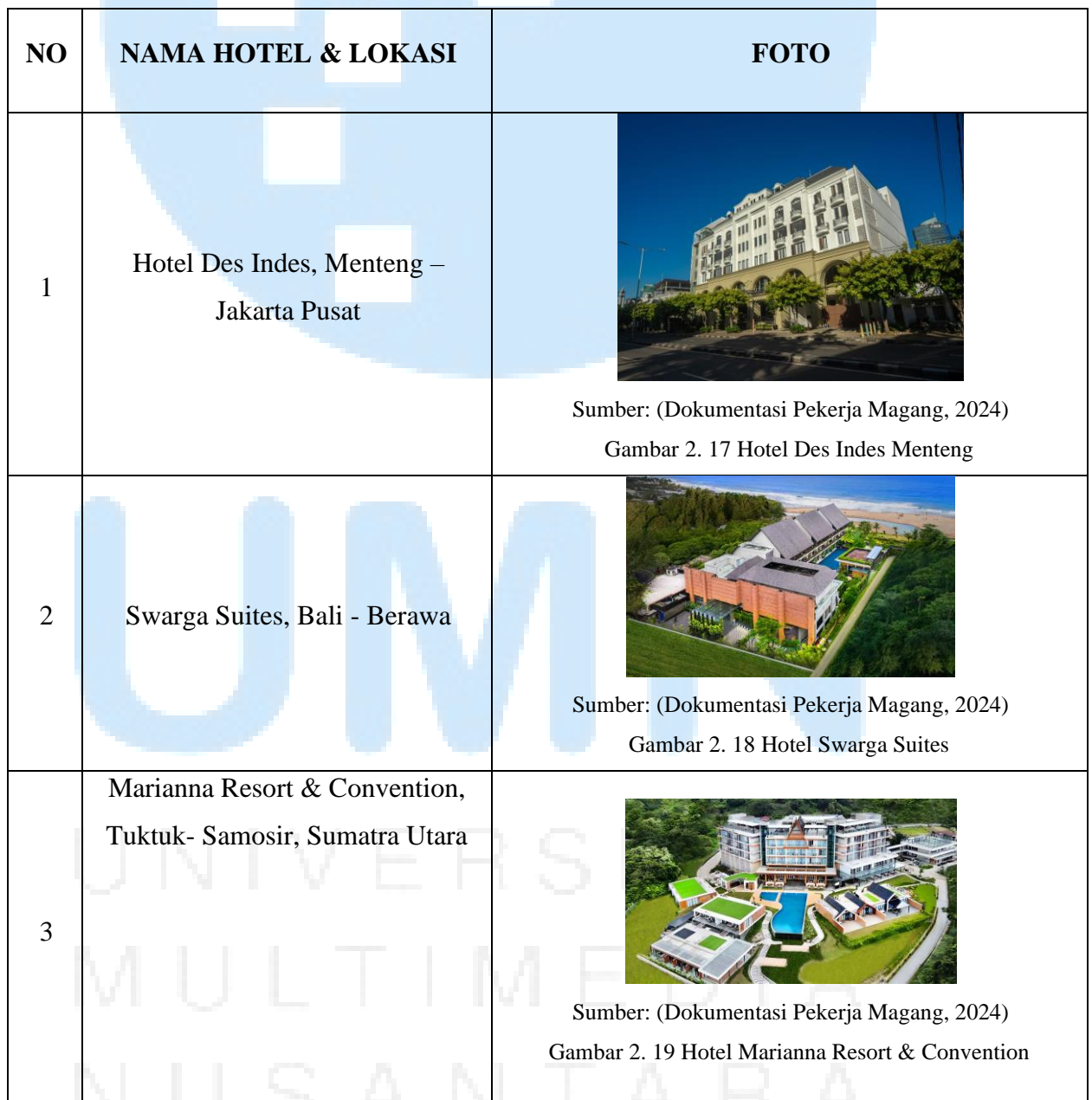
Tabel 2. 2 Marclan Hotel

Sebagai seorang Sales , pekerja magang berkewajiban untuk membantu dalam meningkatkan penjualan, memperkenalkan dan menawarkan Marclan Collection kepada calon pelanggan. Saat ini, terdapat lima hotel yang berada di bawah operasional dari Marclan Collection: