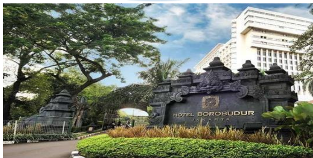
Gambar 2.1.1 Tampak Depan Hotel Borobudur Jakarta

Hotel Borobudur Jakarta adalah salah satu ikon hotel bintang lima yang terletak di pusat kota Jakarta, Indonesia. Dibangun pada tahun 1974, Hotel Borobudur Jakarta baru saja berusia 50th pada 23 Maret 2024. Hotel ini memiliki sejarah yang kaya dan telah menjadi landmark penting dalam industri perhotelan di Indonesia. Terletak strategis di antara daerah bisnis utama dan pusat hiburan Jakarta, Hotel Borobudur Jakarta menawarkan akses mudah ke berbagai destinasi bisnis dan wisata di kota metropolitan ini. Bangunan Hotel Borobudur Jakarta mencerminkan desain arsitektur yang elegan dan klasik dengan sentuhan budaya Indonesia. Dengan taman-taman yang luas dan hijau, kolam renang yang menakjubkan, dan pemandangan kota yang spektakuler, hotel ini memberikan suasana yang tenang dan nyaman bagi para tamu yang menginap (Hotel Borobudur Jakarta, 2024).