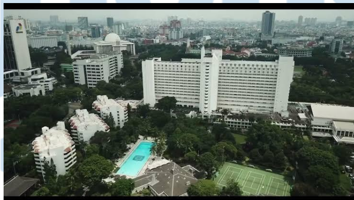
Gambar 2.1.3 Tampak Keseluruhan Hotel Borobudur Jakarta

Hotel Borobudur Jakarta juga menyediakan berbagai fasilitas seperti pusat kebugaran yang lengkap, lapangan tenis, lapangan golf mini, dan spa mewah. Para tamu dapat menikmati berbagai perawatan spa yang menyegarkan dan menyegarkan tubuh dan pikiran mereka setelah seharian beraktivitas. Dengan layanan yang ramah dan profesional, fasilitas yang lengkap, dan lokasi yang strategis, Hotel Borobudur Jakarta menjadi pilihan yang sempurna bagi wisatawan bisnis maupun liburan yang mencari pengalaman menginap yang istimewa di pusat kota Jakarta. Hotel Borobudur Jakarta dikenal karena komitmennya terhadap keberlanjutan dan tanggung jawab sosial. Mereka telah mengadopsi berbagai inisiatif ramah lingkungan, termasuk penggunaan energi terbarukan, pengurangan limbah, dan praktik pengelolaan air yang efisien. Hotel ini juga aktif dalam berbagai kegiatan sosial dan program kemanusiaan, termasuk dukungan terhadap pendidikan dan kesejahteraan masyarakat sekitar.