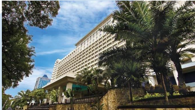
Gambar 2.1.2 Tampak Samping Hotel Borobudur Jakarta

Hotel Borobudur Jakarta juga menyediakan berbagai fasilitas seperti pusat kebugaran yang lengkap, lapangan tenis, lapangan golf mini, dan spa mewah. Para tamu dapat menikmati berbagai perawatan spa yang menyegarkan dan menyegarkan tubuh dan pikiran mereka setelah seharian beraktivitas. Dengan layanan yang ramah dan profesional, fasilitas yang lengkap, dan lokasi yang strategis, Hotel Borobudur Jakarta menjadi pilihan yang sempurna bagi wisatawan bisnis maupun liburan yang mencari pengalaman menginap yang istimewa di pusat kota Jakarta. Hotel Borobudur Jakarta dikenal karena komitmennya terhadap keberlanjutan dan tanggung jawab sosial. Mereka telah mengadopsi berbagai inisiatif ramah lingkungan, termasuk penggunaan energi terbarukan, pengurangan limbah, dan praktik pengelolaan air yang efisien. Hotel ini juga aktif dalam berbagai kegiatan sosial dan program kemanusiaan, termasuk dukungan terhadap pendidikan dan kesejahteraan masyarakat sekitar.