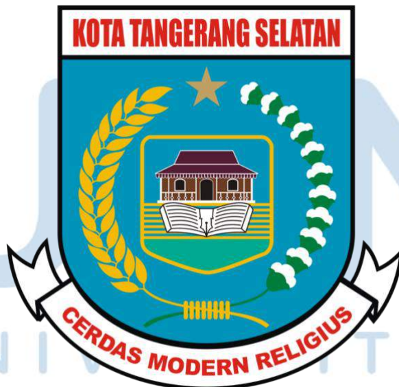
Gambar 2.1 Logo Diskominfo Tangerang Selatan

Kota Tangerang Selatan adalah daerah otonom yang ada pada akhir tahun 2008 berdasarkan Undang-Undang Nomor 51 Tahun 2008 tentang Pembentukan Kota Tangerang Selatan, Provinsi Banten tanggal 26 November 2008. Kota Tangerang Selatan merupakan hasil pemecahan dari Kabupaten Tangerang. Pemecahan ini bertujuan untuk memberikan peluang dalam meningkatkan pelayanan di pemerintahan, pembangunan dan sektor sosial, memanfaatkan potensi lokal, dan mempercepat terwujudnya kesejahteraan masyarakat. Kota Tangerang Selatan berada di bagian timur Provinsi Banten dengan luas daerah sebesar 147,19 km 2 atau 14.719 hektar dan memiliki tujuh kecamatan dan 54 kelurahan. Penduduk yang terdaftar dalam Dinas Kependudukan dan Catatan Sipil pada tahun 2023 di Kota Tangerang Selatan berjumlah 1.414.619 jiwa (Disdukcapil, 2023).