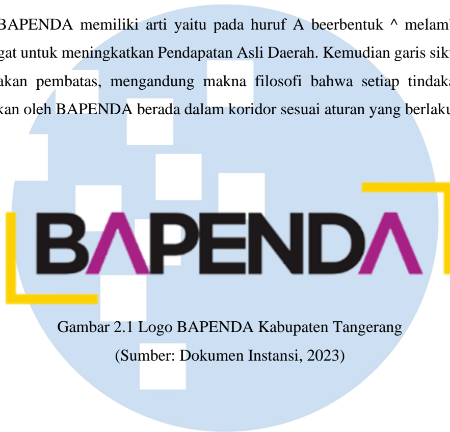
Gambar 2.1 Logo BAPENDA Kabupaten Tangerang

Logo BAPENDA memiliki arti yaitu pada huruf A beerbentuk ^ melambangkan semangat untuk meningkatkan Pendapatan Asli Daerah. Kemudian garis siku 2 buah merupakan pembatas, mengandung makna filosofi bahwa setiap tindakan yang dilakukan oleh BAPENDA berada dalam koridor sesuai aturan yang berlaku.